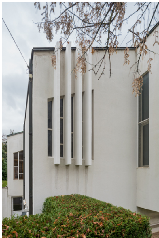
Vue de l'angle sud-est du temple et de ses façades en saillie.