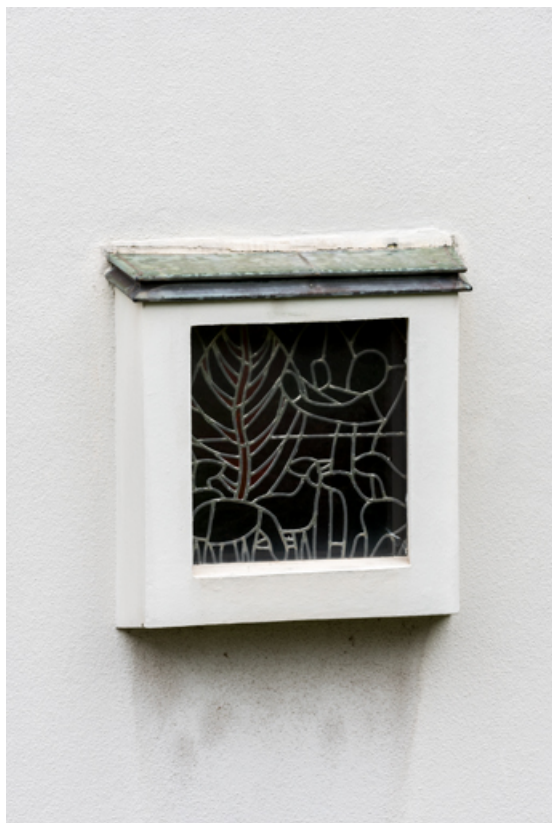
Vue extérieure de la verrière en vitrail (baie 0 - gauche).