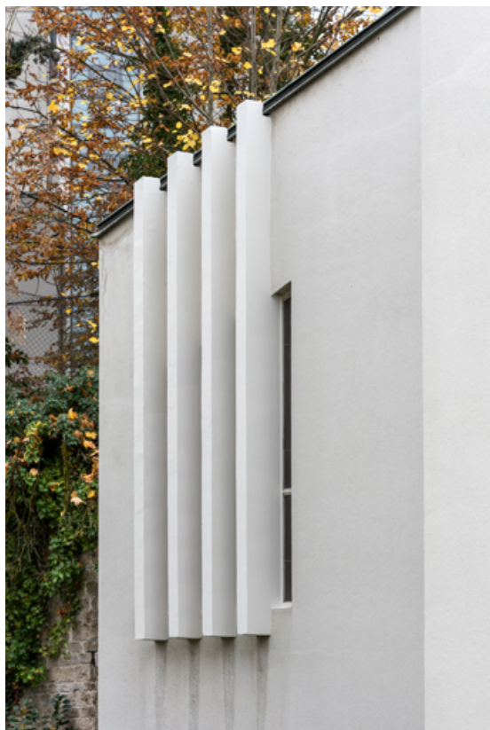
Détail de la baie de la façade est (baie 3).