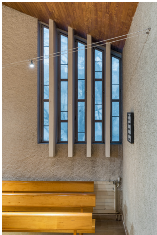
Vue intérieure de la baie du mur est (baie 3). 71, Mâcon, 32 rue Saint-Antoine