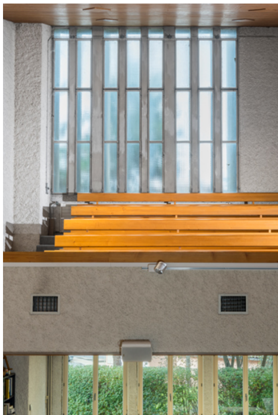
Vue de la baie donnant sur la tribune (baie 102).