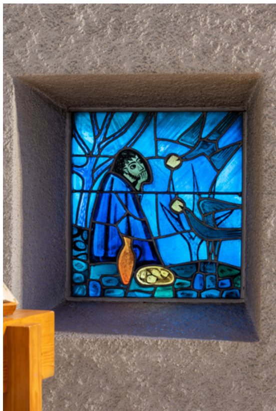
Vue de la verrière en vitrail de gauche (baie 0, droite). 71, Mâcon, 32 rue Saint-Antoine