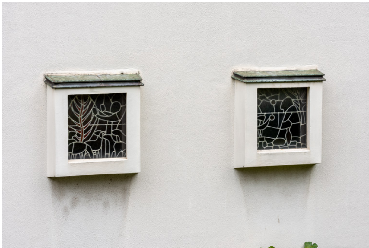
Vue extérieure de l'ensemble des deux baies avec leur verrière en vitrail (baies 0).