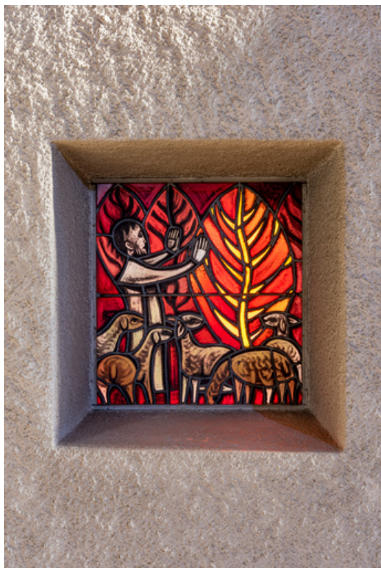
Vue de la verrière en vitrail de droite (baie 0, gauche). 71, Mâcon, 32 rue Saint-Antoine