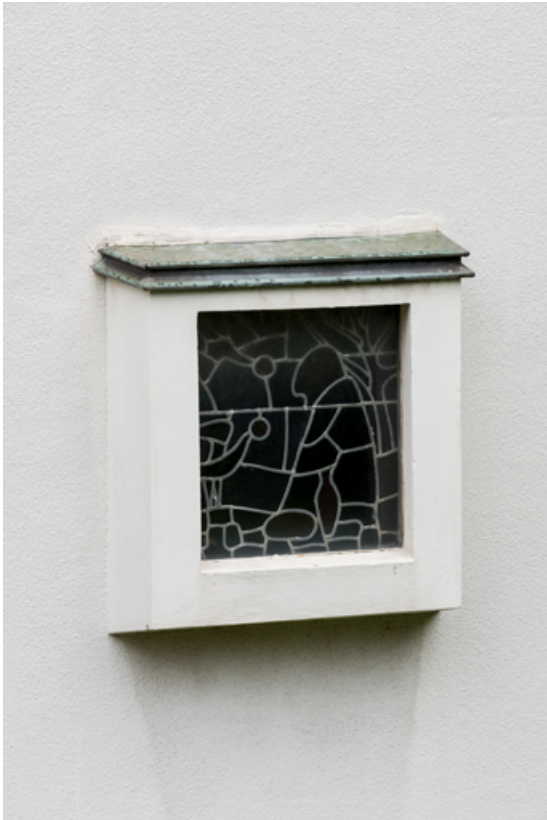
Vue extérieure de la verrière en vitrail (baie 0 - droite). 71, Mâcon, 32 rue Saint-Antoine