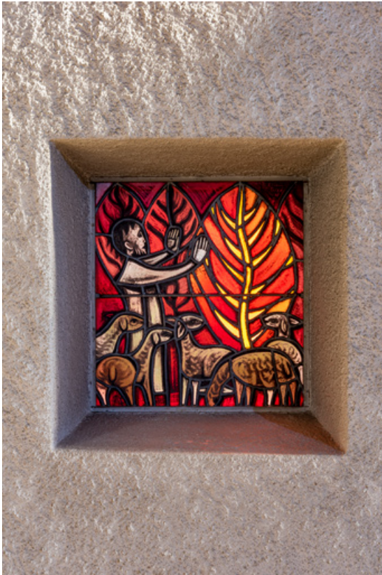
Vue de la verrière en vitrail de droite (baie 0, gauche). 71, Mâcon, 32 rue Saint-Antoine