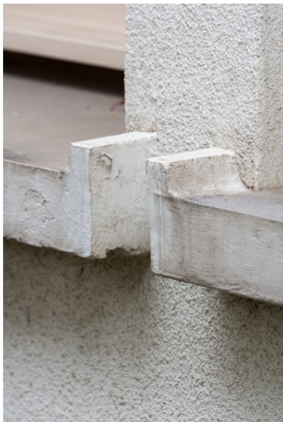
Détail des appuis saillants des baies de la façade nord (baie 4).