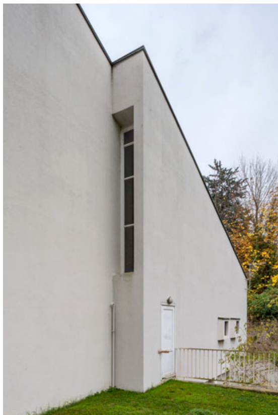
Vue du mur ouest (de trois-quarts, en direction du sud). 71, Mâcon, 32 rue Saint-Antoine