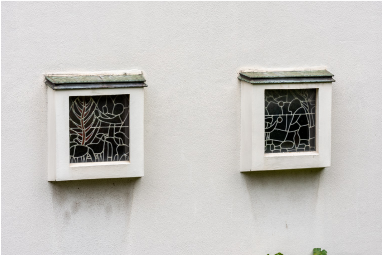
Vue extérieure de l'ensemble des deux baies avec leur verrière en vitrail (baies 0).