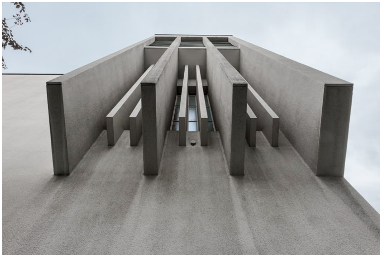
Détail du jeu de pilastres formant la console du clocher et des meneaux en béton armé (baie 102). 71, Mâcon, 32 rue Saint-Antoine