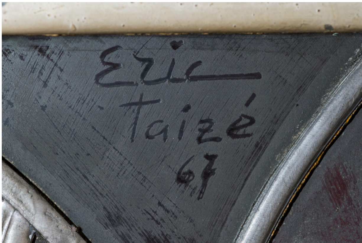
Détail de la signature sur le vitrail (baie 0, gauche).