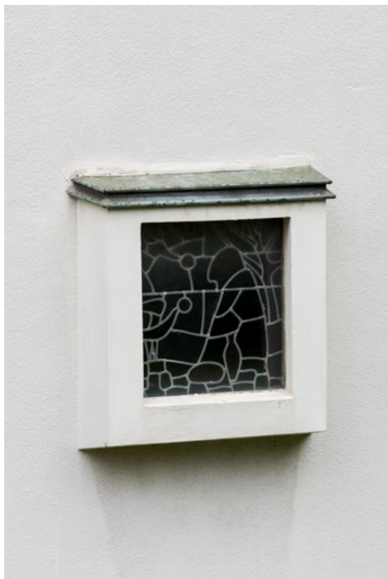
Vue extérieure de la verrière en vitrail (baie 0 - droite). 71, Mâcon, 32 rue Saint-Antoine