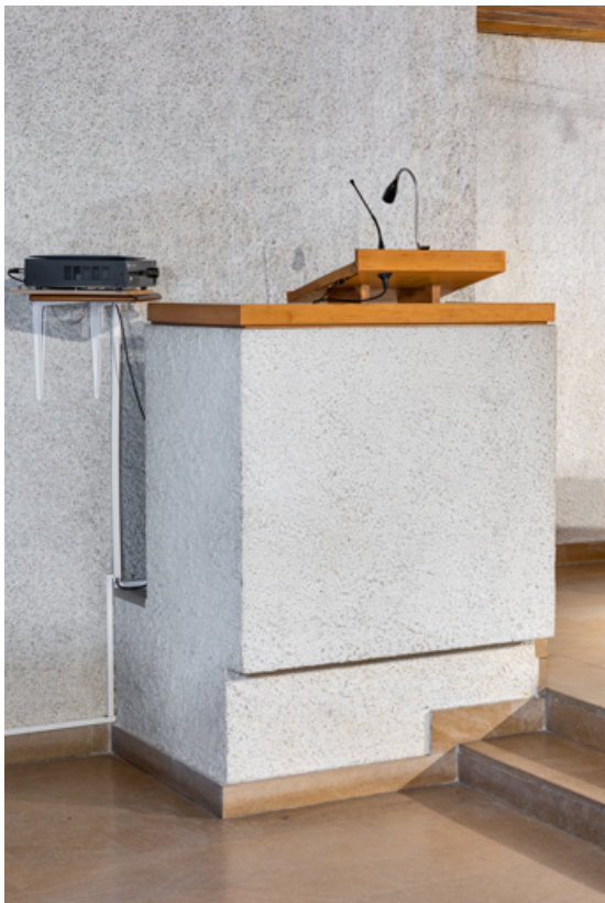
Vue de trois quarts.