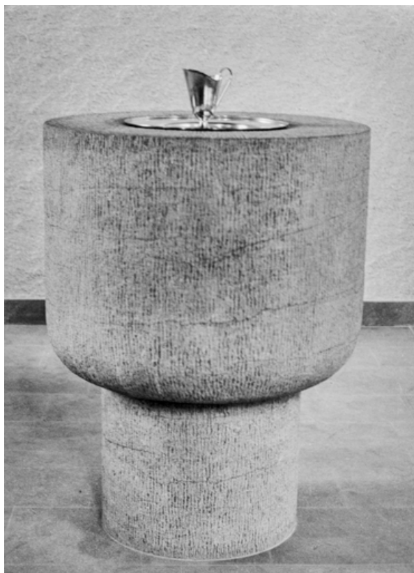
Vue des fonds baptismaux avec le plat de présentation et son aiguière. 71, Mâcon, 32 rue Saint-Antoine

[vue de la cuve baptismale]. Photographie noir et blanc sur papier baryté émulsion gélatino bromure Agfa Portriga Rapid. s. n. ; [1967]. 13 x 18 cm.