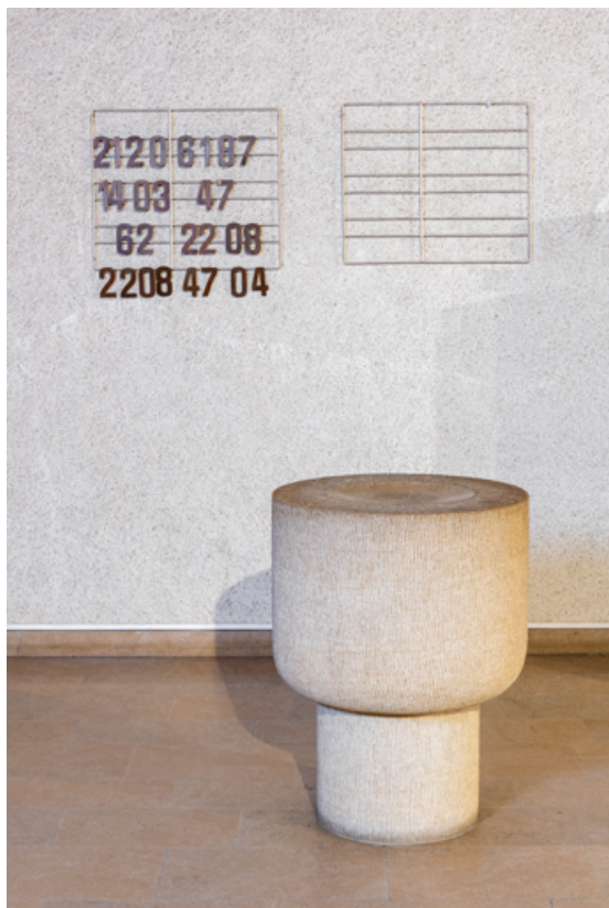
Vue des fonts baptismaux et des tableaux des chants et des psaumes.