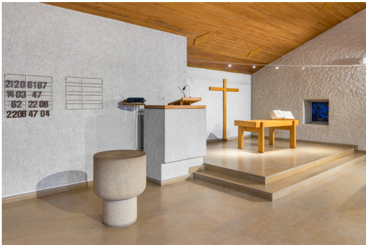
Vue intérieure du temple en direction de l'estrade accueillant la table de communion.