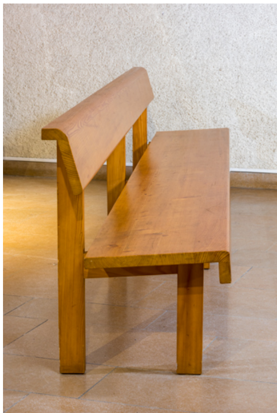
Vue d'un banc de temple (de côté).