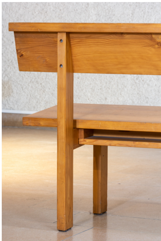
Détail de l'extrémité du banc de temple.