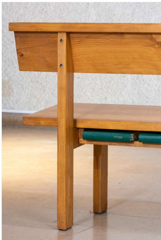
Détail du casier pour les livres de cantiques, placés sous l'assise du banc. 71, Mâcon, 32 rue Saint-Antoine