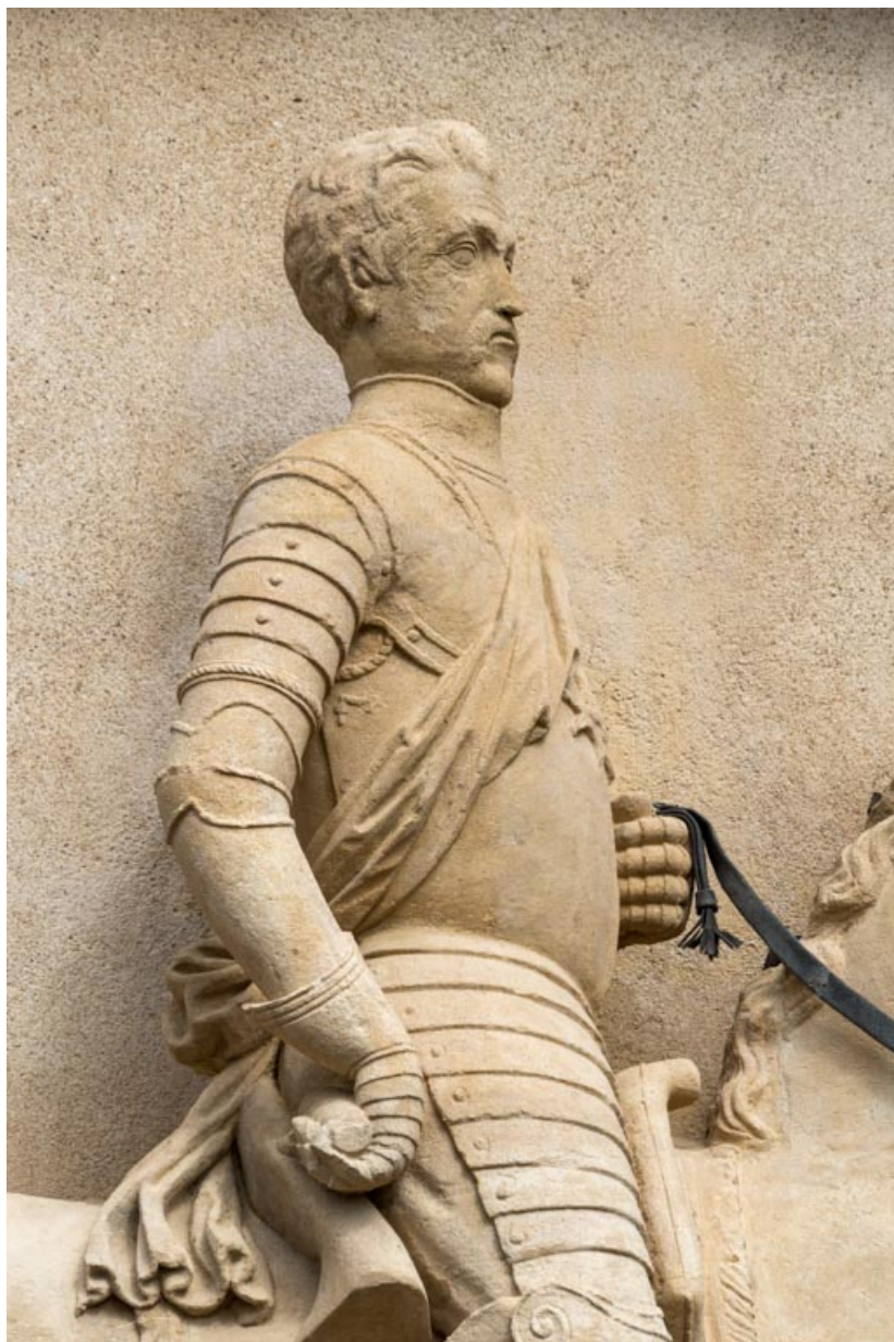
Haut-relief, portrait équestre, détail.

71, Saint-Bonnet-de-Joux chemin du Bois de Chaumont, lieudit : Château de Chaumont