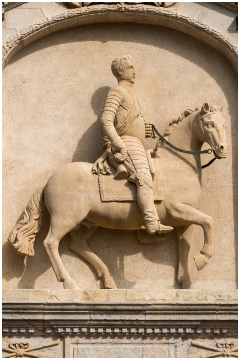
Haut-relief, portrait équestre, détail.

71, Saint-Bonnet-de-Joux chemin du Bois de Chaumont, lieudit : Château de Chaumont