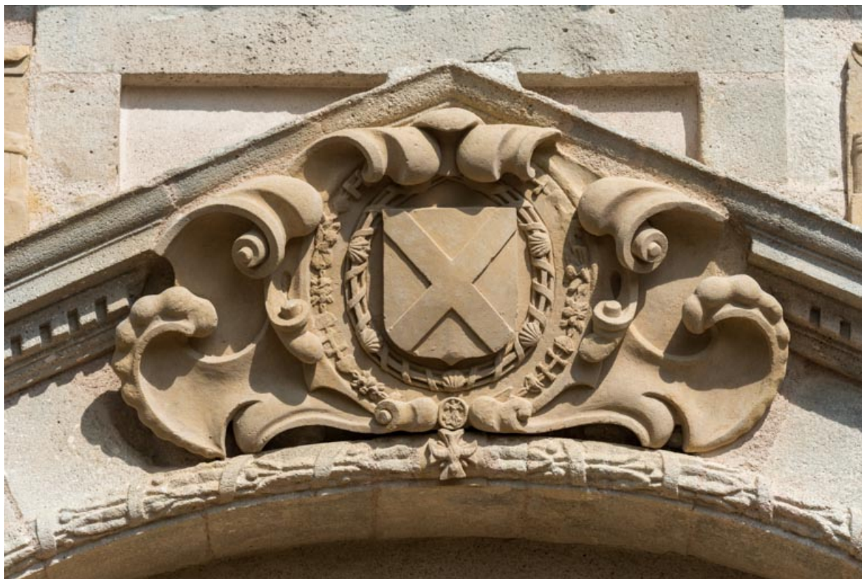
Cartouche à cuir découpé portant l'écu armorié de la famille La Guiche entouré des colliers des ordres de Saint-Michel et du Saint-Esprit.

71, Saint-Bonnet-de-Joux chemin du Bois de Chaumont, lieudit : Château de Chaumont