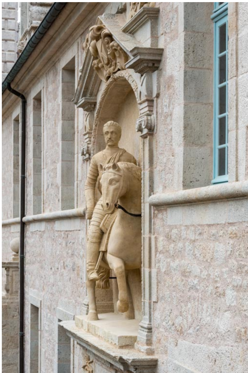
Haut-relief, portrait équestre, vue de face.

71, Saint-Bonnet-de-Joux chemin du Bois de Chaumont, lieudit : Château de Chaumont