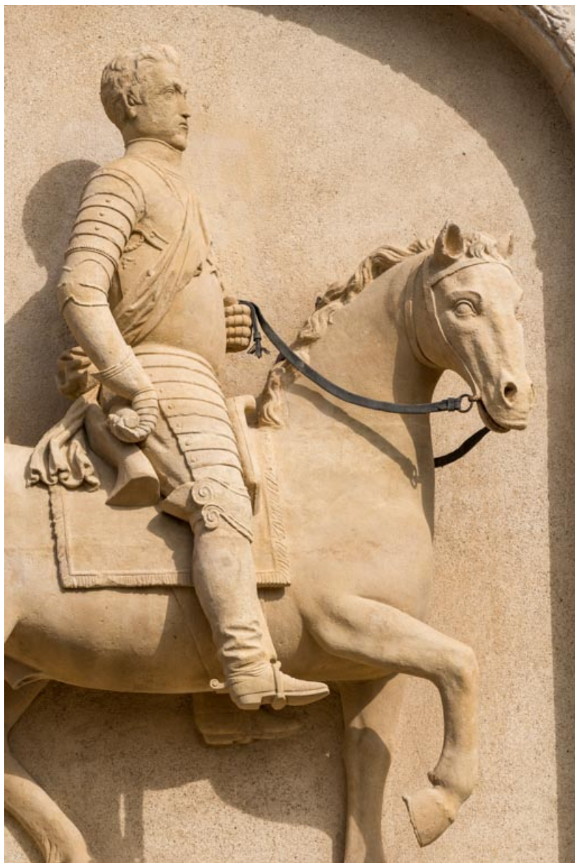
Haut-relief, portrait équestre, détail.

71, Saint-Bonnet-de-Joux chemin du Bois de Chaumont, lieudit : Château de Chaumont