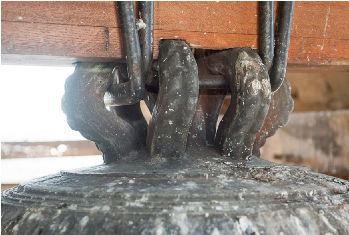
Détail du cerveau : colombettes 2-4-6.