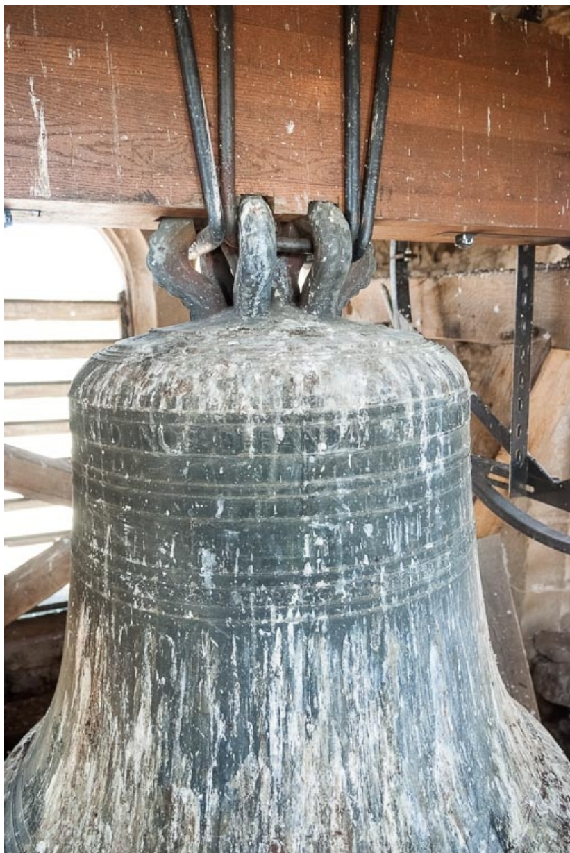
Cerveau de la cloche.