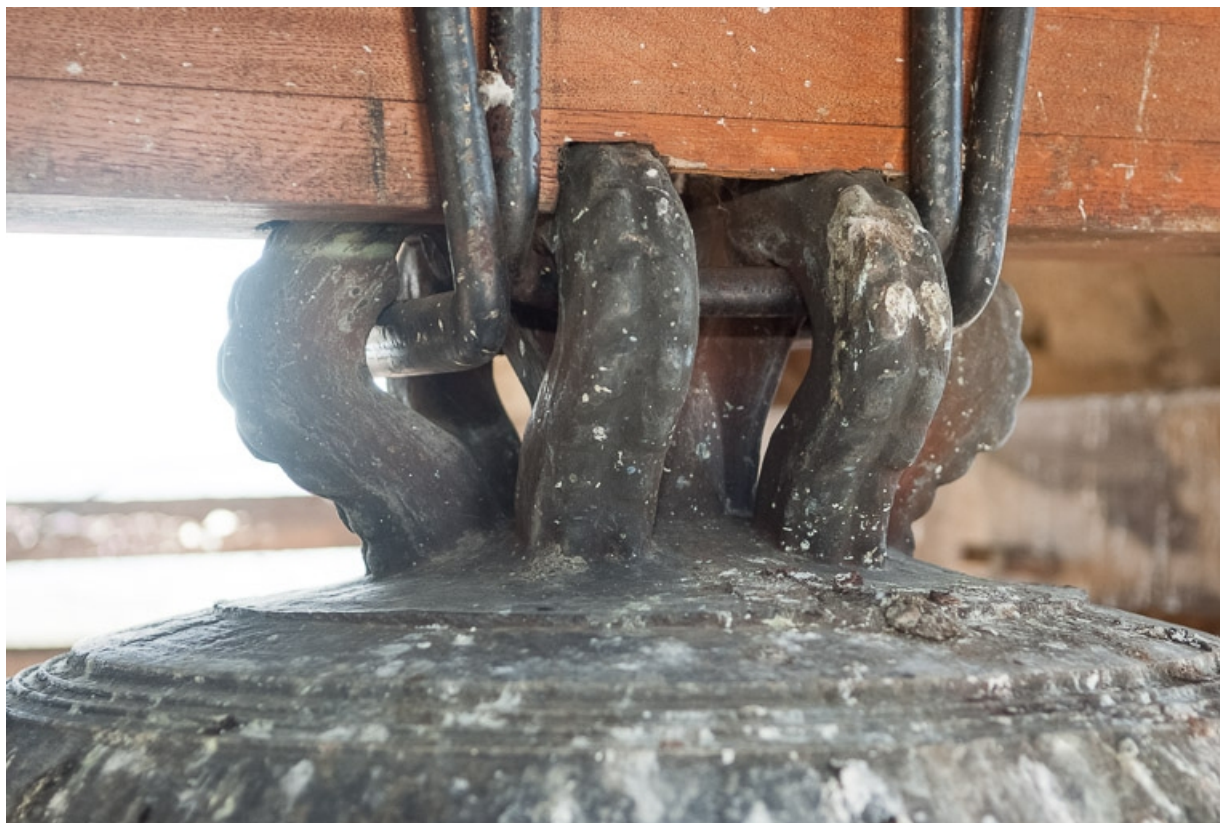
Détail du cerveau : colombettes 2-4-6.