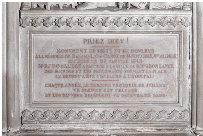
Détail de la travée centrale : inscription commémorative.