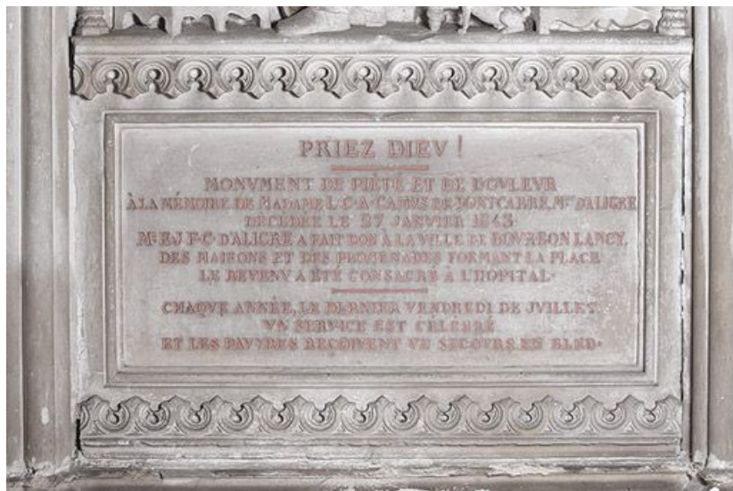
Détail de la travée centrale : inscription commémorative.