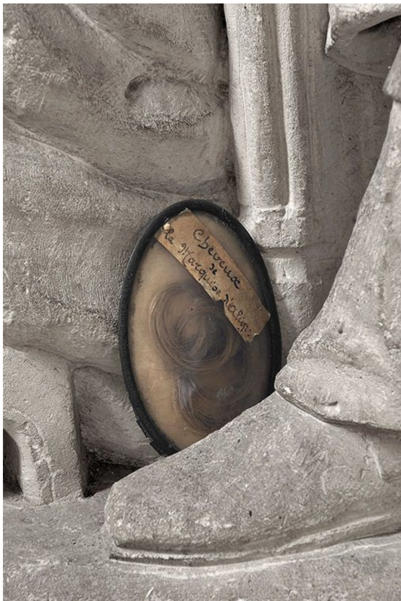
Détail : médaillon contenant des cheveux de la marquise d'Aligre. 71, Bourbon-Lancy rue de la Chaumière