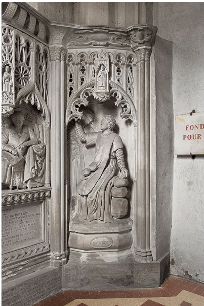
Travée droite : saint Etienne.