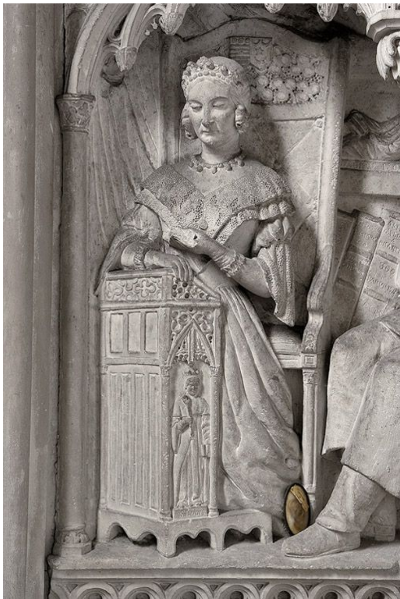
Détail de la travée centrale : la marquise d'Aligre.