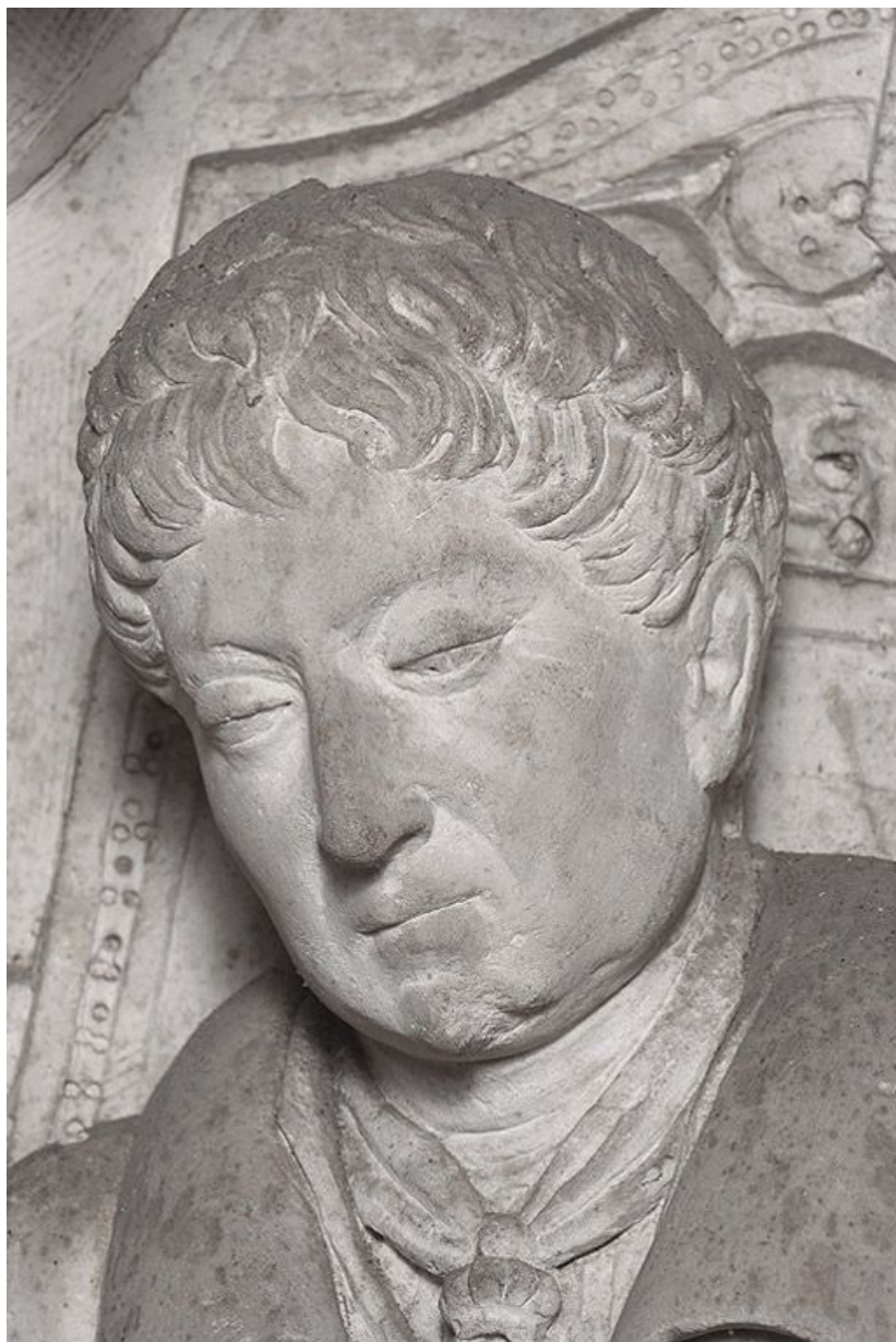
Détail : tête du marquis d'Aligre.