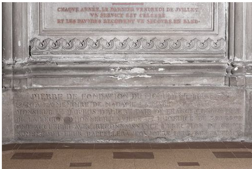
Détail : soubassement de la travée centrale.