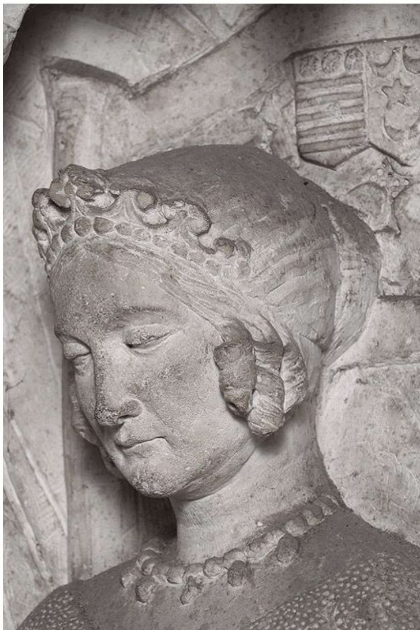
Détail : tête de la marquise d'Aligre. 71, Bourbon-Lancy rue de la Chaumière