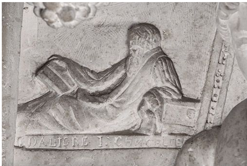
Détail : reproduction de la statue funéraire du chancelier Etienne Ier d'Aligre. 71, Bourbon-Lancy rue de la Chaumière