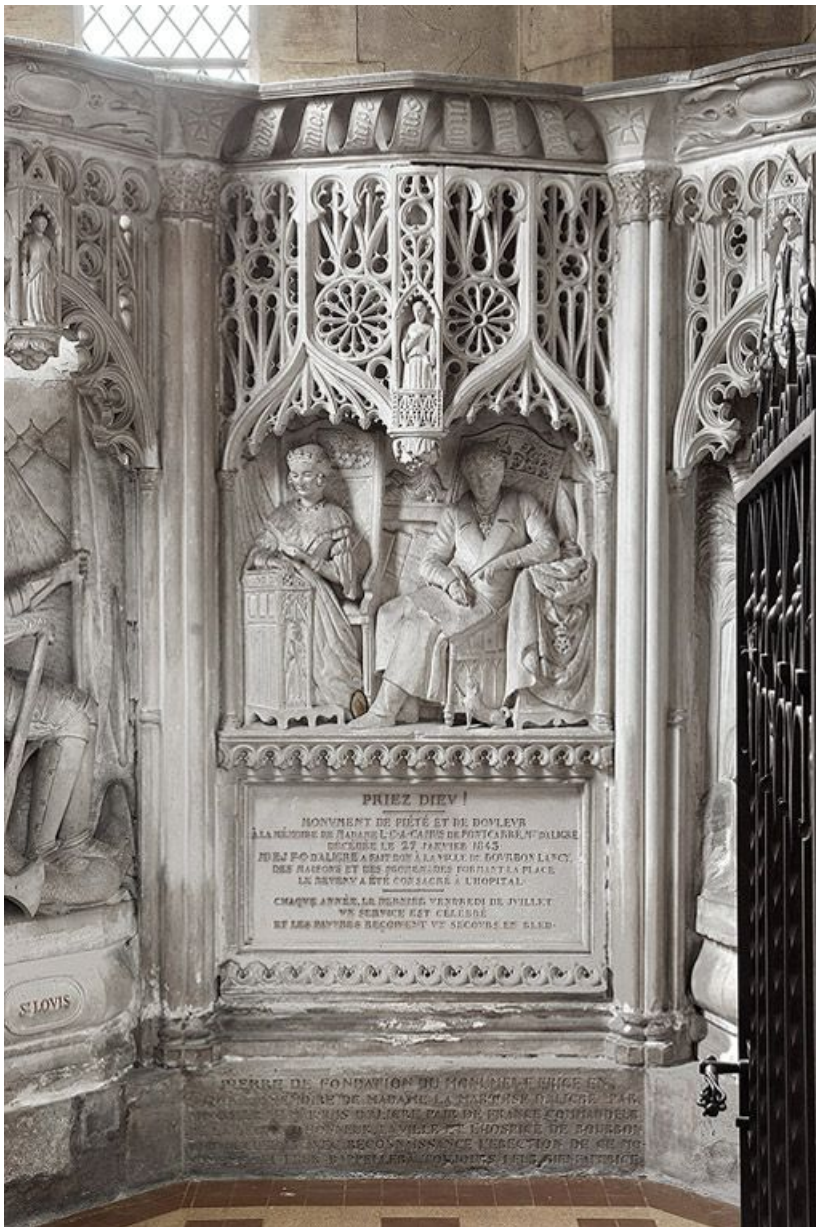
Travée centrale : la marquise et le marquis d'Aligre. 71, Bourbon-Lancy rue de la Chaumière