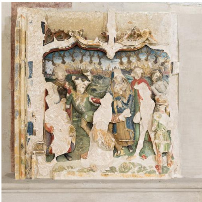
Détail du panneau représentant le portement de Croix.

71, Laives montée de Lenoux, lieudit : Lenoux