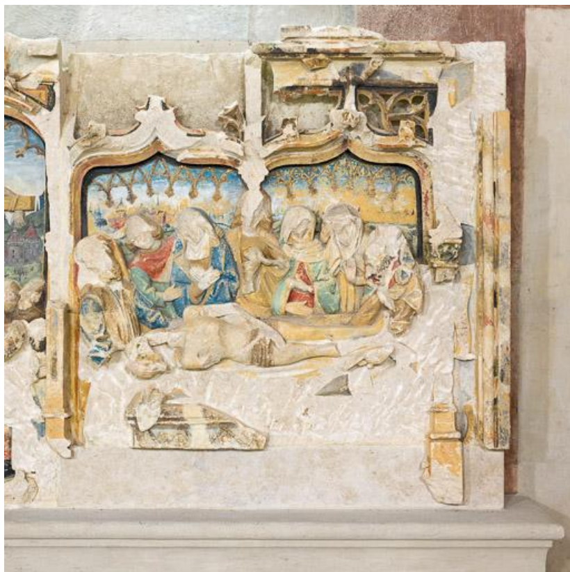
Détail du panneau représentant la Mise au tombeau.

71, Laives montée de Lenoux, lieudit : Lenoux