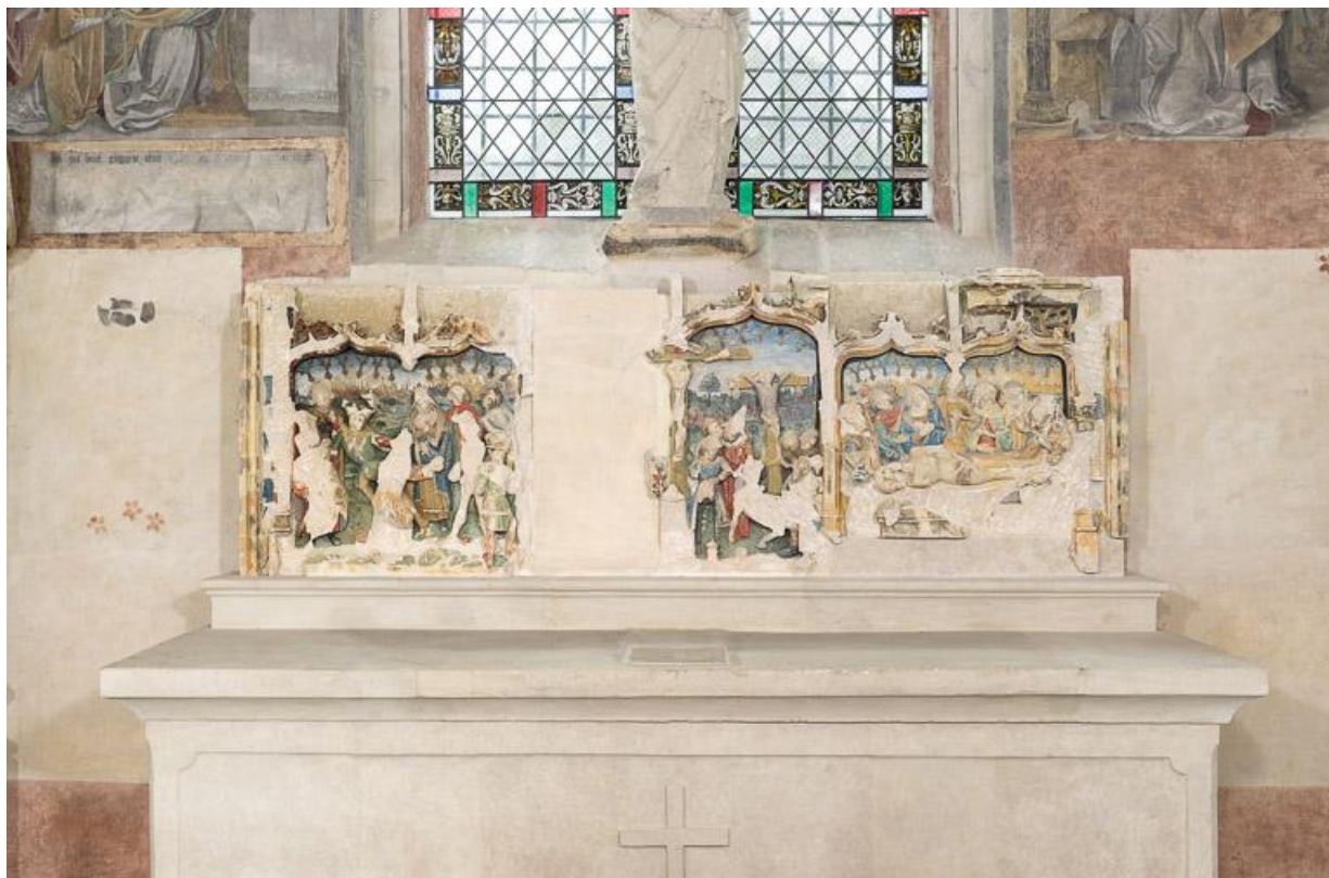
Vue d'ensemble du retable, récemment restauré et posé sur l'autel.

71, Laives montée de Lenoux, lieudit : Lenoux