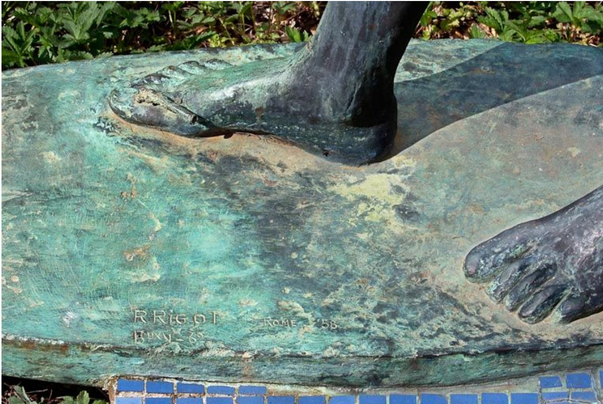
Détail de la signature.