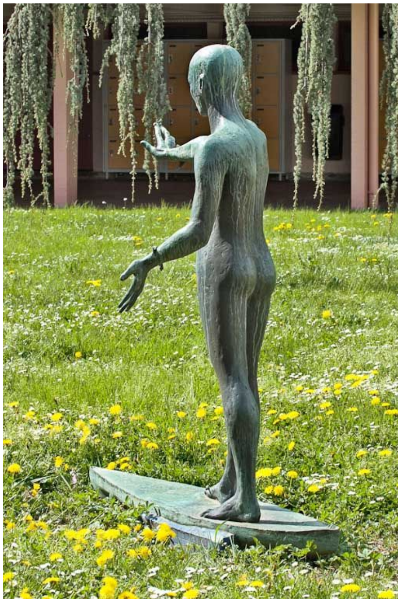
Vue de trois-quarts arrière.