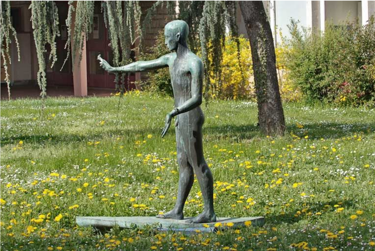
Vue d'ensemble, latérale.