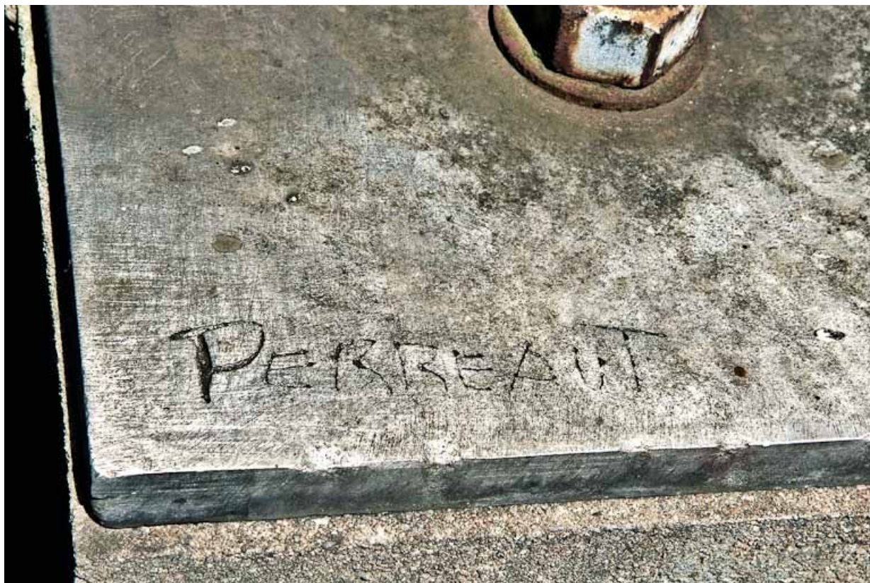
Détail de la signature.