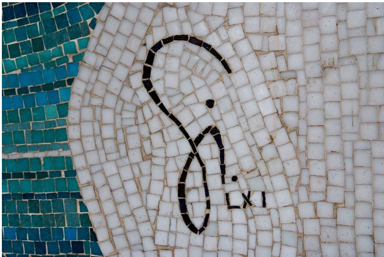
Détail de la signature.

71, Chalon-sur-Saône lycée Pontus de Tyard