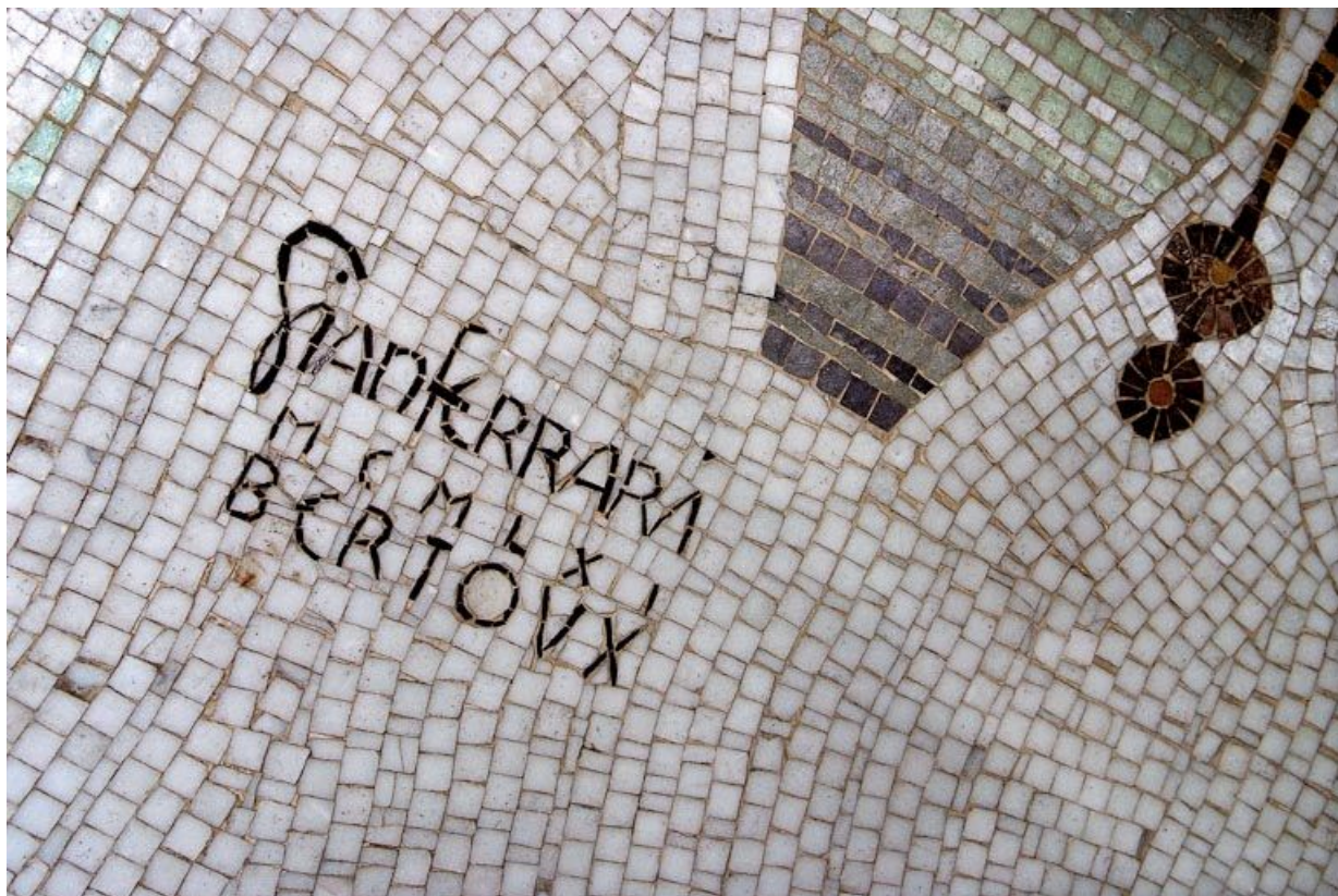
Détail de la signature.

71, Chalon-sur-Saône lycée Pontus de Tyard