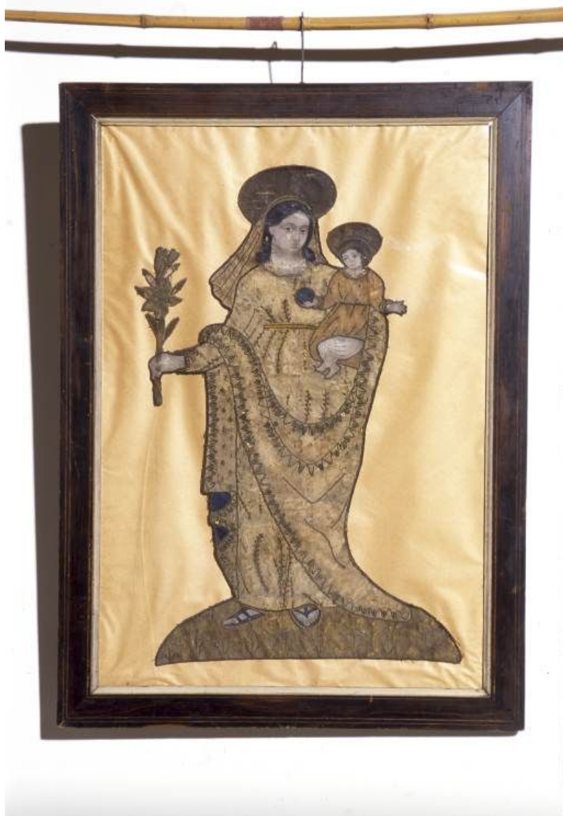
Fragment de bannière de procession : Vierge à l'Enfant.