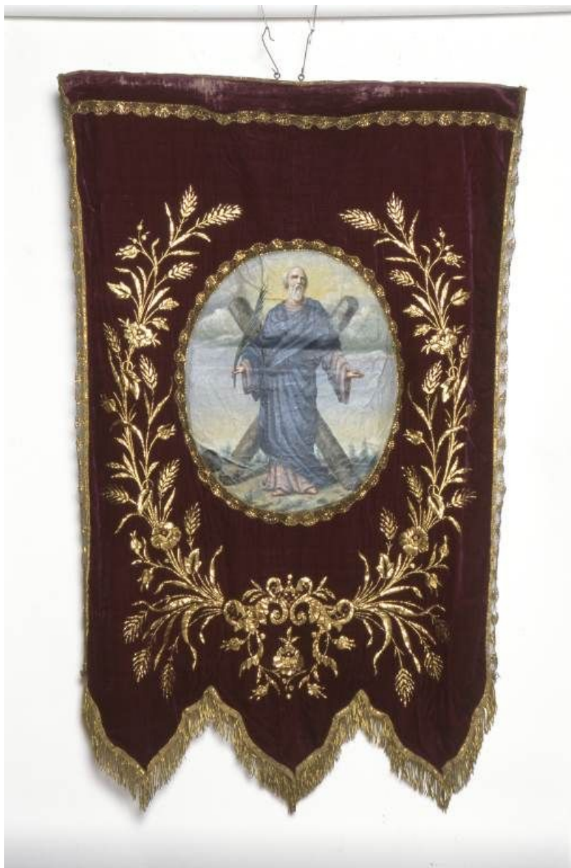
Bannière : côté saint André.