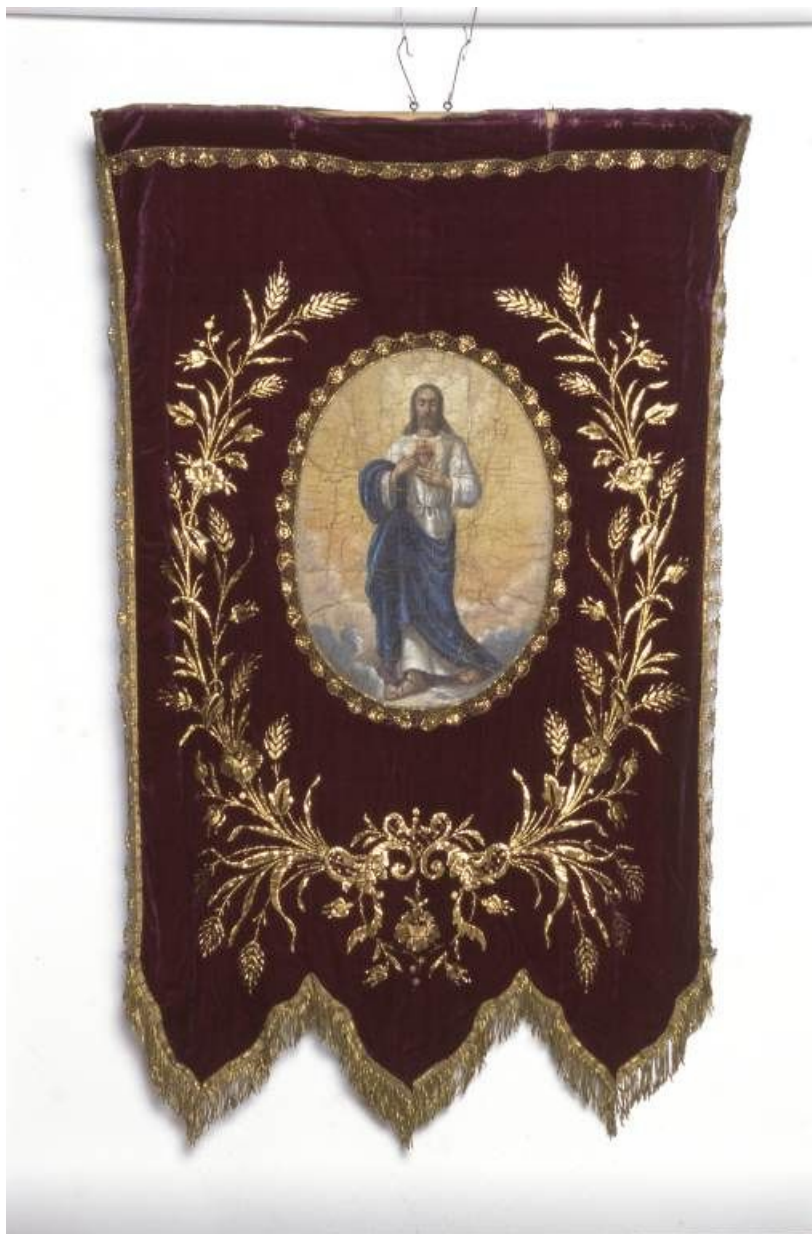
Bannière : côté Sacré-Coeur.