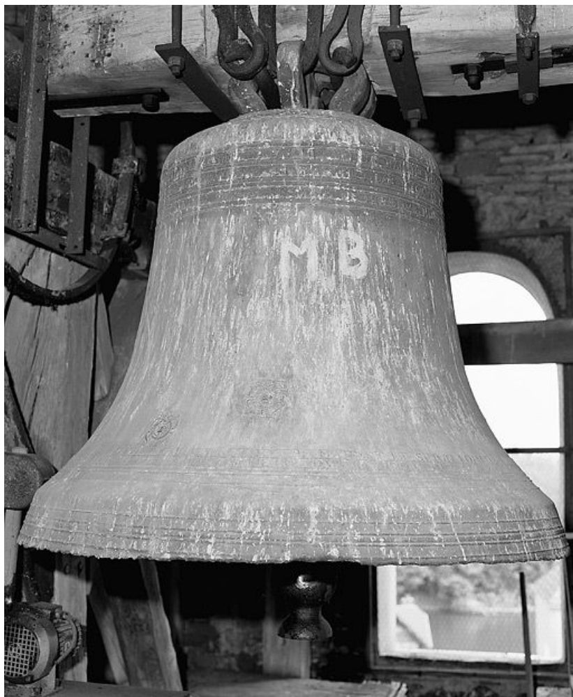
Vue d'ensemble, face antérieure.

71, rue de la Verdun-sur-le-Doubs République