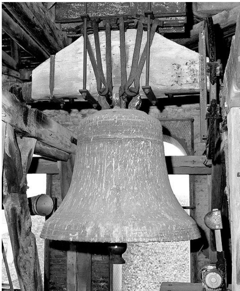
Vue d'ensemble, face postérieure.

71, rue de la Verdun-sur-le-Doubs République