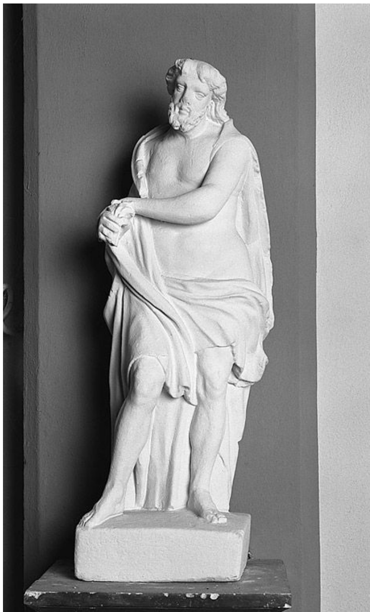
Vue de face.