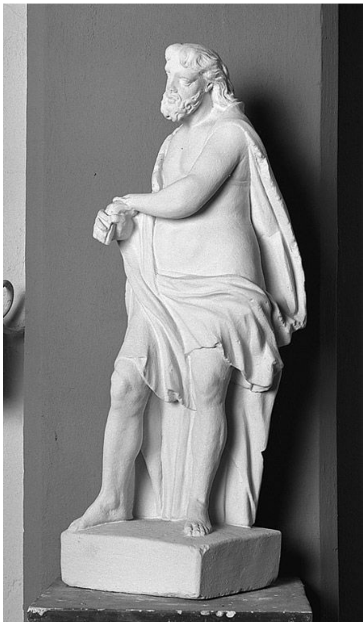
Vue de trois-quarts.