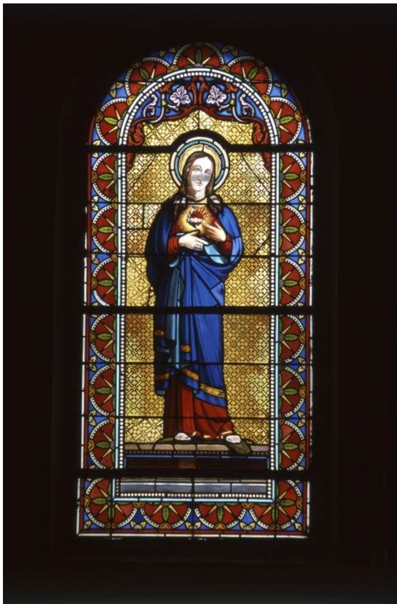
Vitrail de la chapelle droite : Saint Coeur de Marie.