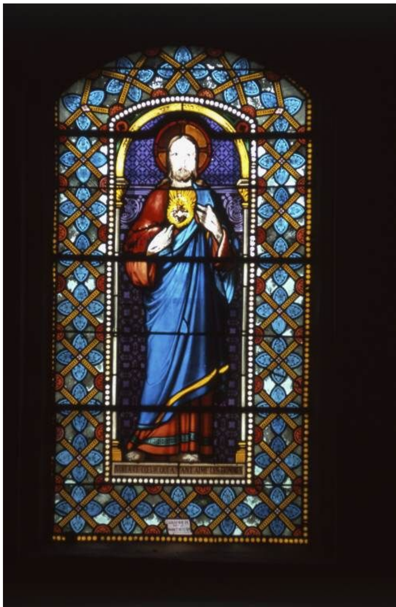
Vitrail de la chapelle gauche : Sacré-Coeur.