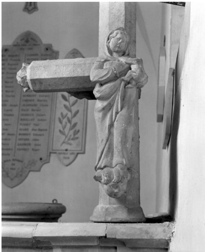
Côté Vierge à l'Enfant.