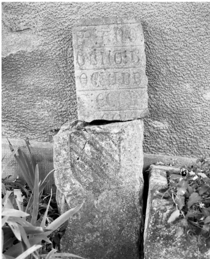
Troisième borne et fragment de pierre portant une inscription fin du 12e ou début 13e siècle. collection particulière