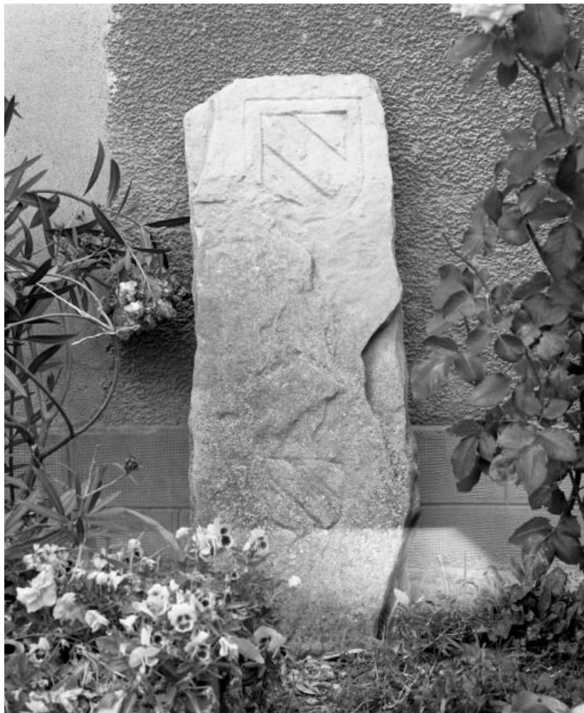
Première borne. collection particulière