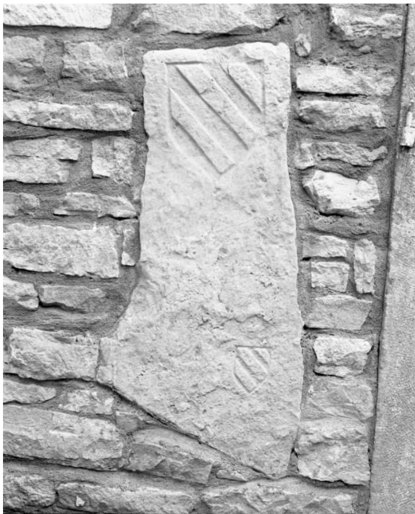
Deuxième borne. collection particulière