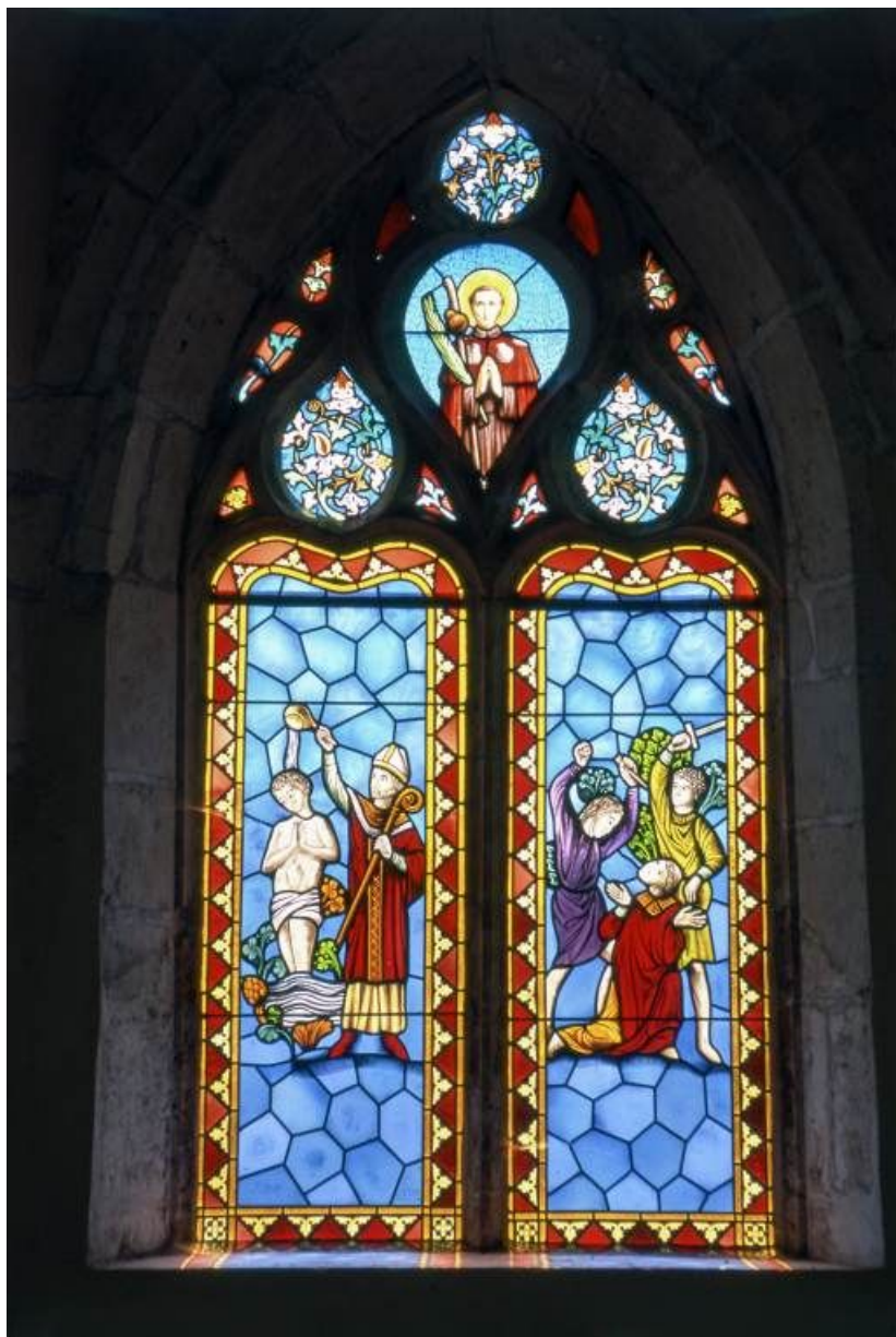
Vitrail du chœur : Baptême et martyre de saint Gervais de Chalon, au-dessus le saint en pèlerin. 71, Saint-Gervais-en-Vallière Eglise