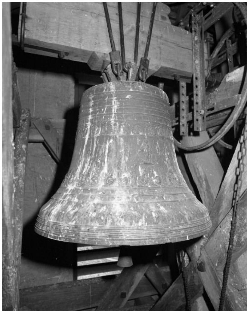
Face antérieure. 71, Pontoux Eglise