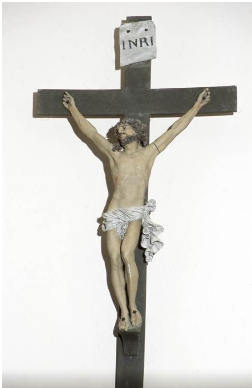
Vue d'ensemble de trois-quarts gauche.