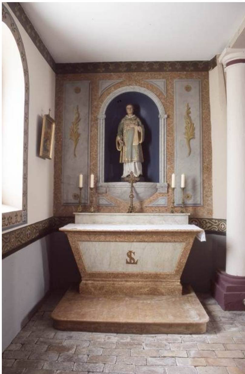
Autel-retable de saint Laurent.