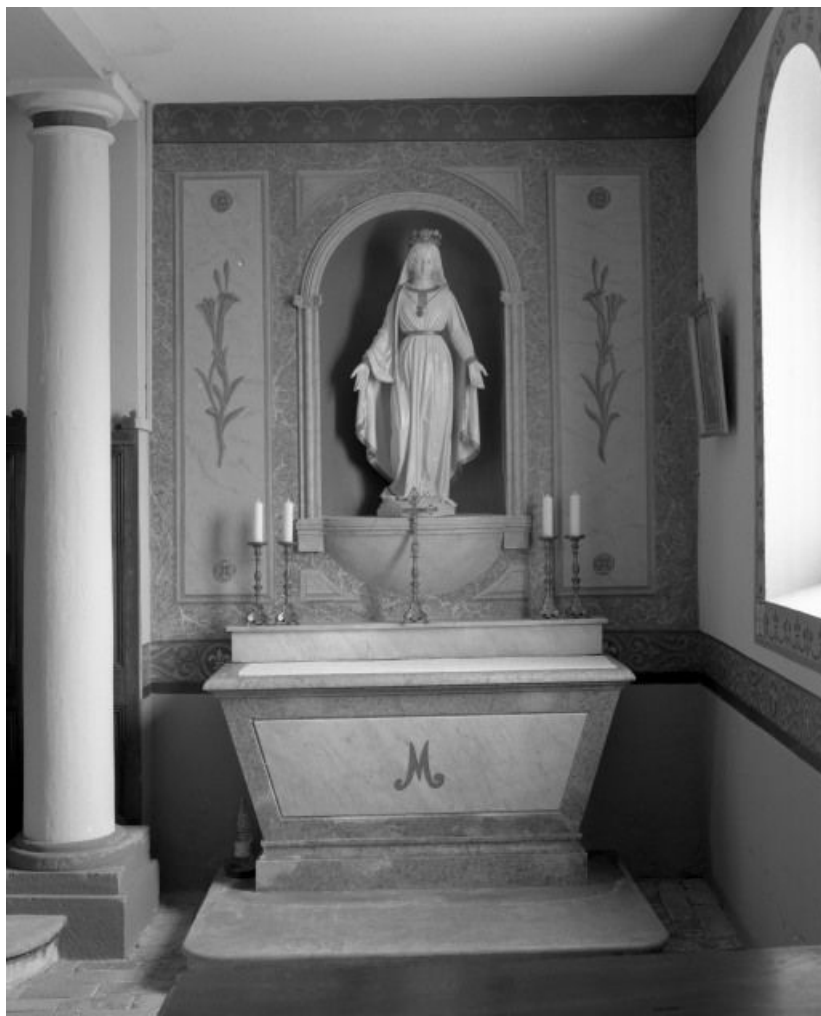
Autel-retable de l'Immaculée conception.