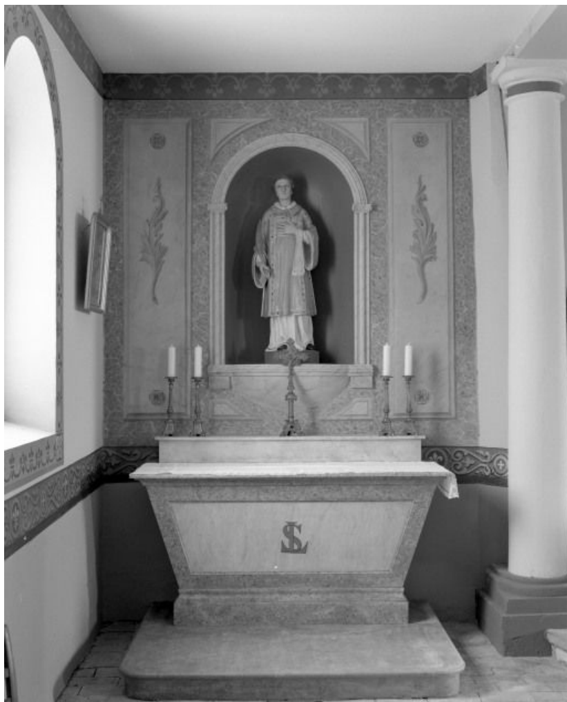
Autel-retable de saint Laurent.