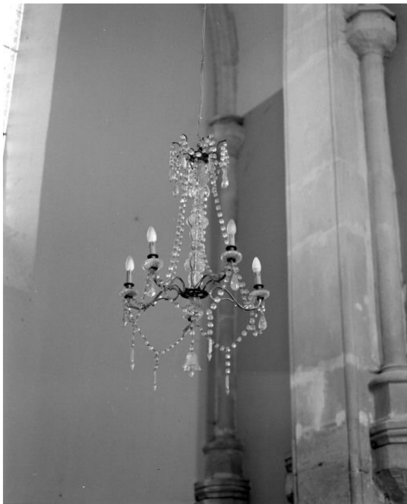
Lustre du bras gauche du transept.