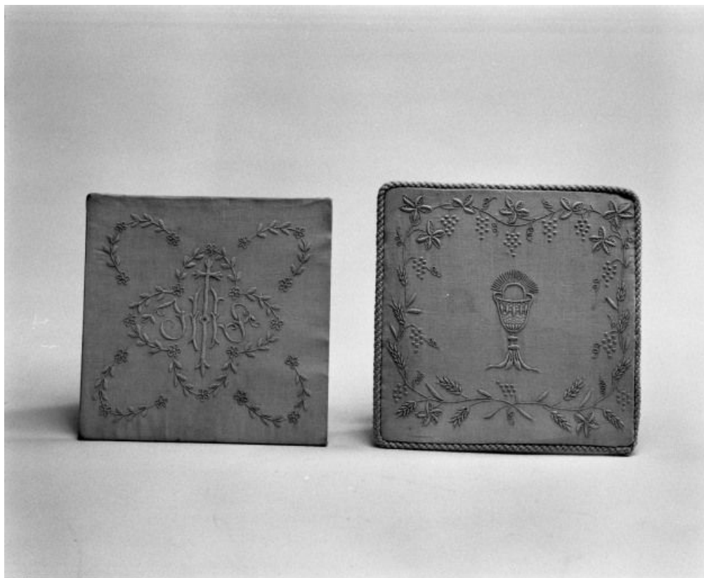
Deux pales blanches.