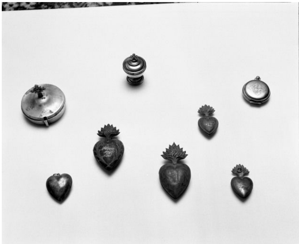
Vue d'ensemble. 71, Écuellen Eglise