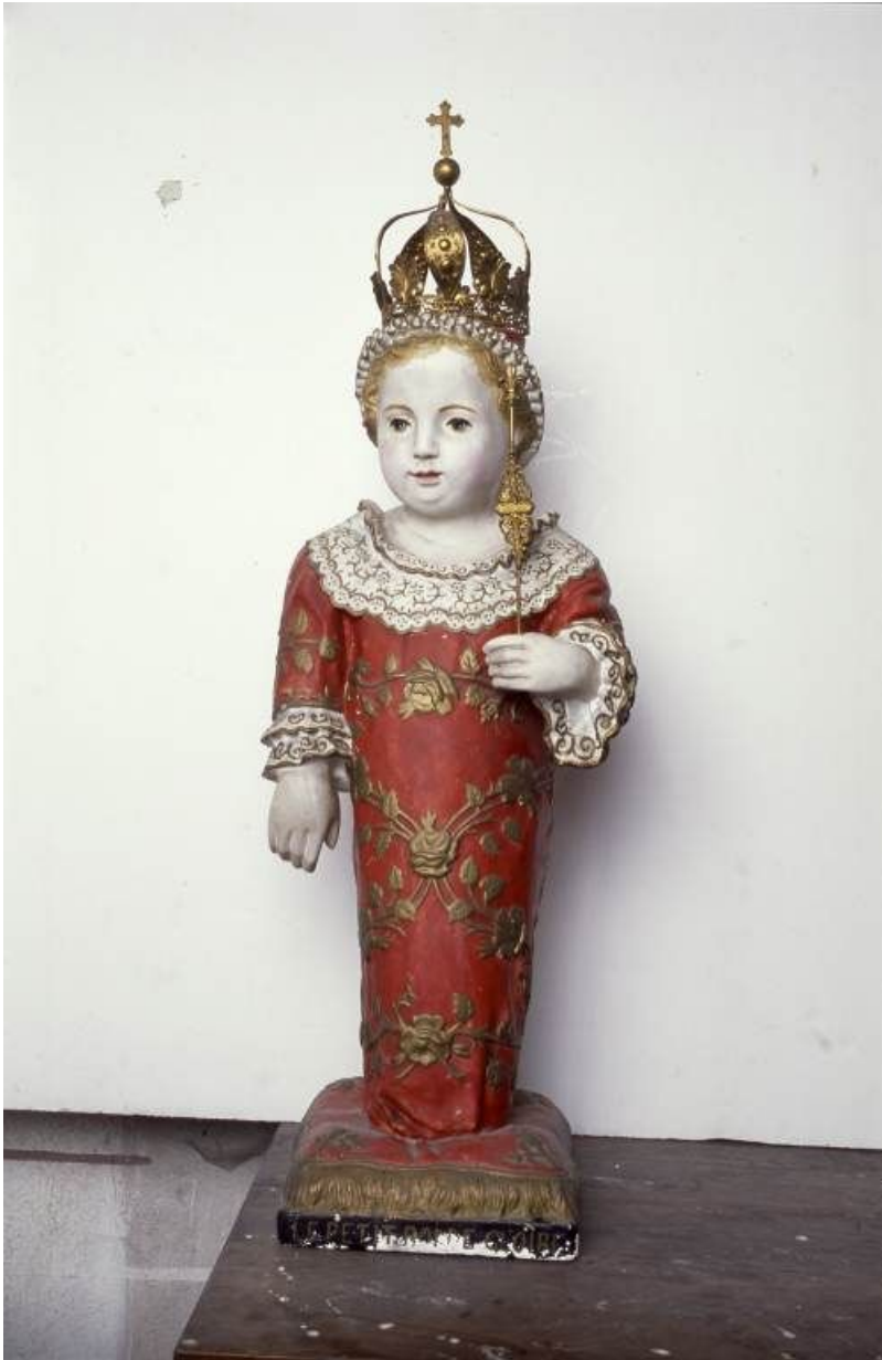
Le " petit Roi de gloire " du carmel de Beaune.