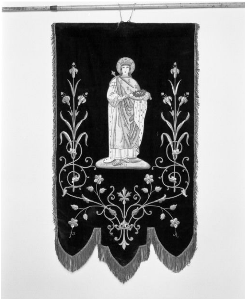
Bannière de saint Louis.