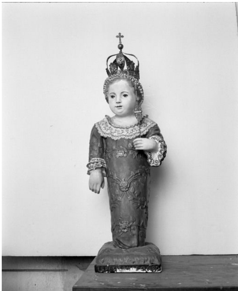
Le " petit Roi de gloire " du carmel de Beaune. 71, Écuellen Eglise