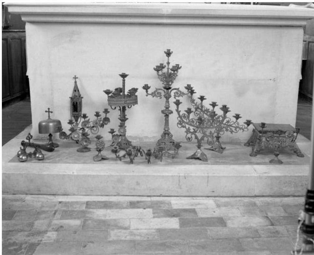
Vue d'ensemble. 71, Écuellen Eglise