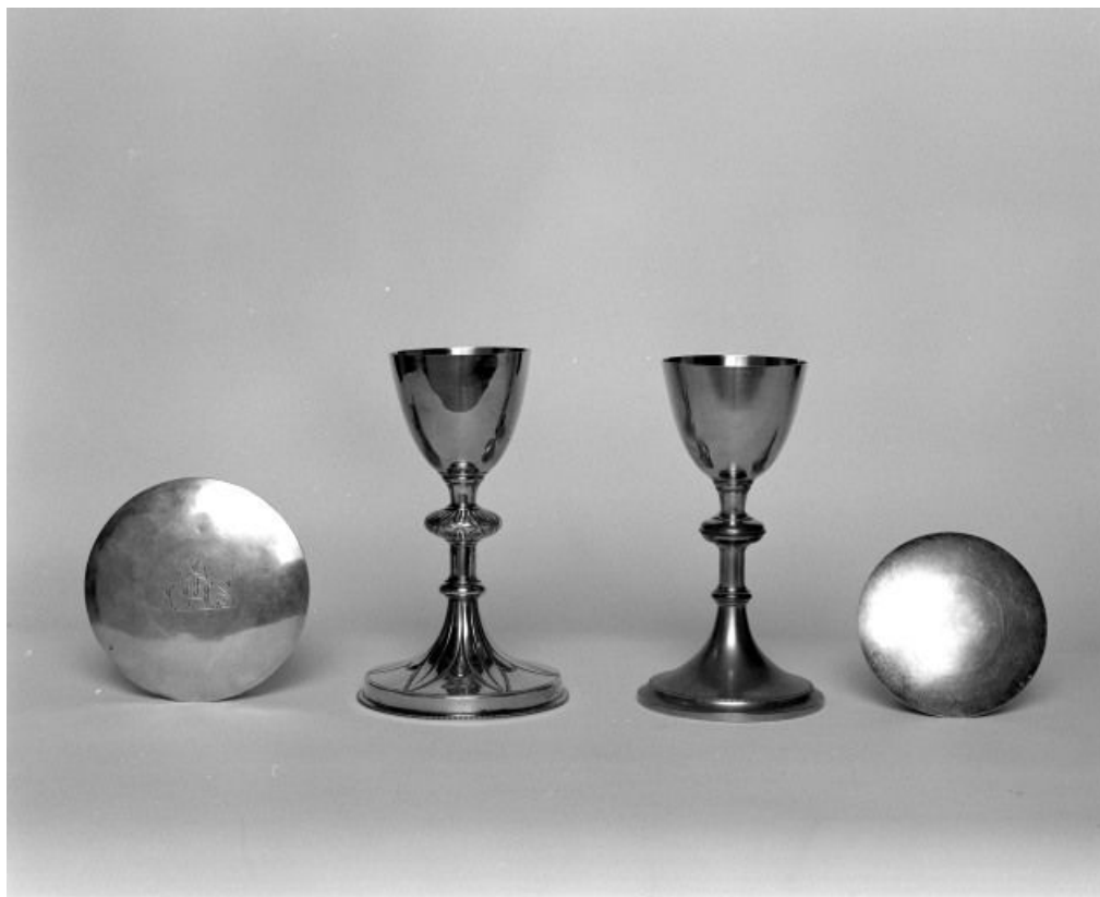
Vue d'ensemble. 71, Écuellen Eglise