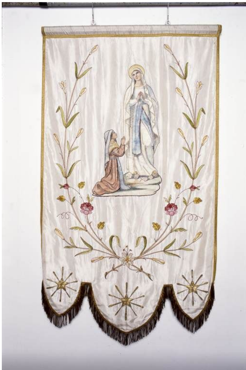
Bannière de Notre-Dame de Lourdes