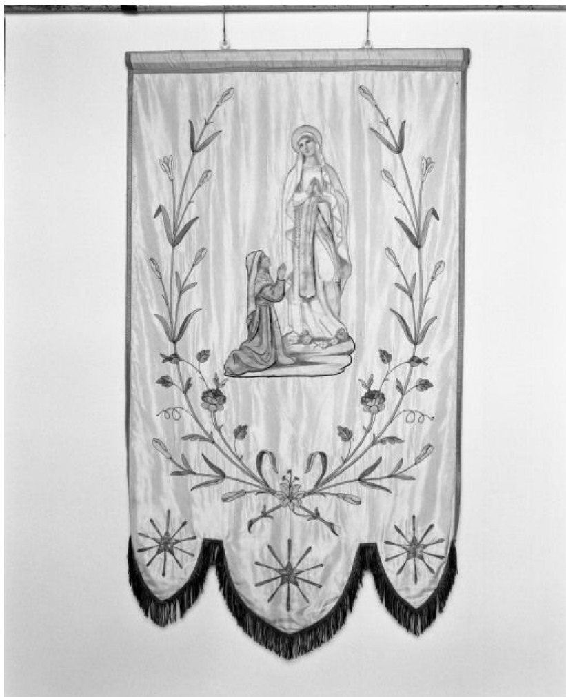
Bannière de Notre-Dame de Lourdes