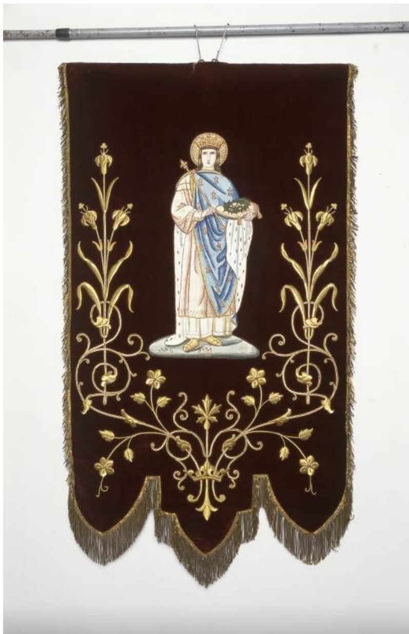
Bannière de saint Louis