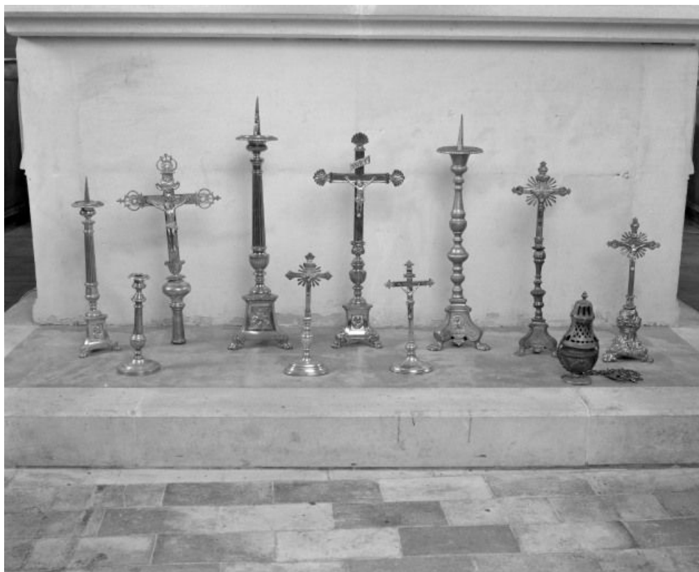
Vue d'ensemble. 71, Écuellen Eglise