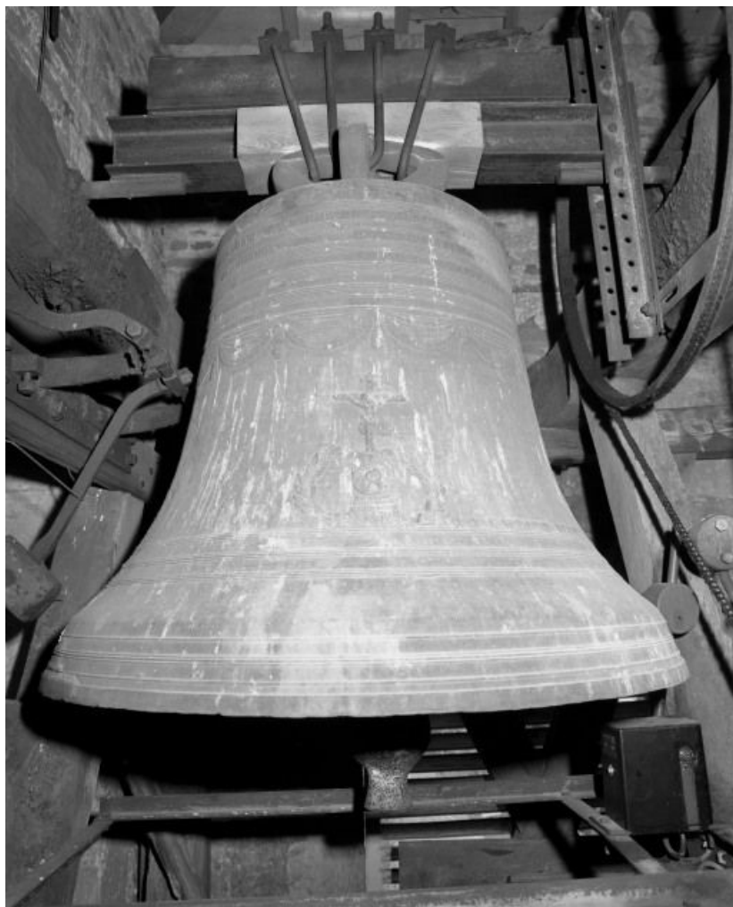
Face antérieure. 71, Écuellen Eglise