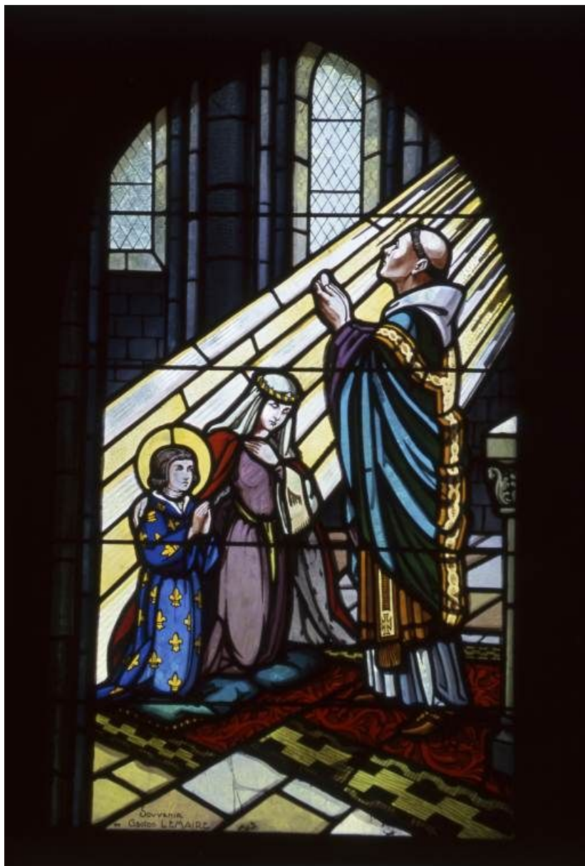
Baie 5 : Blanche de Castille et saint Louis enfant recevant la communion. 71, Écuellles Eglise