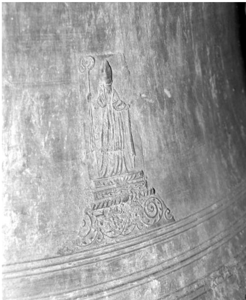
Détail : saint évêque.