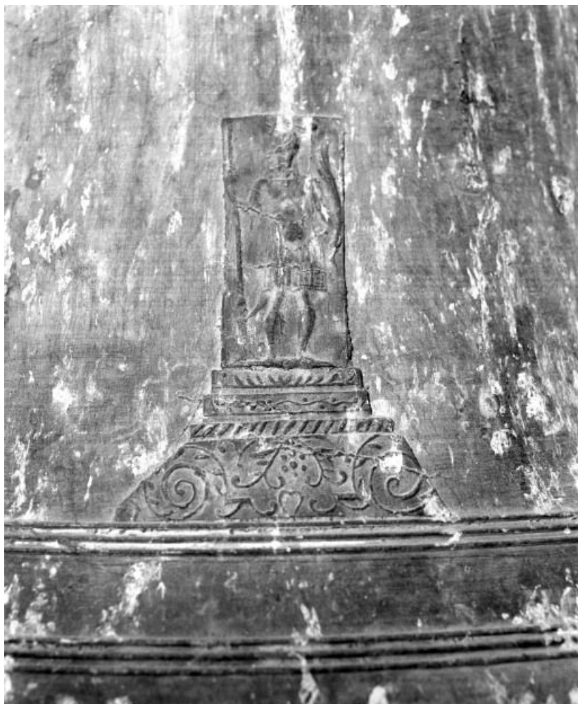
Détail : saint Michel.