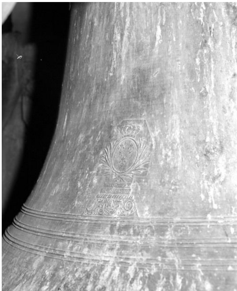
Détail : Armoiries.