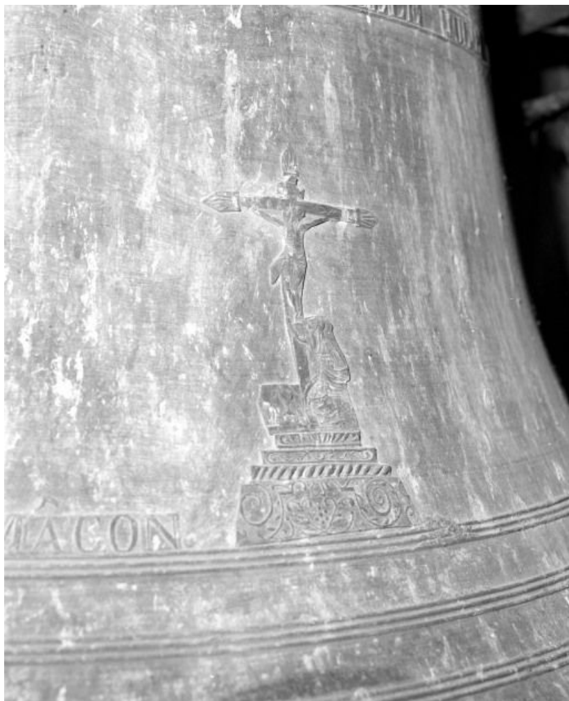
Détail : Christ en croix.