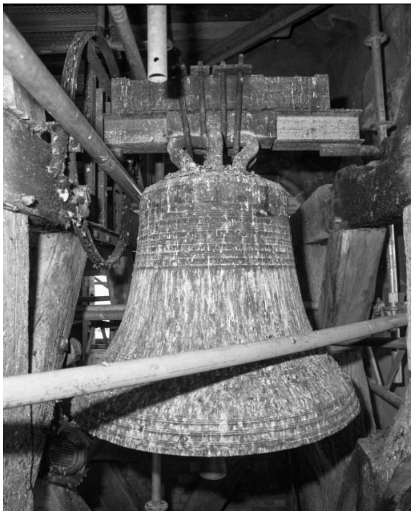
Vue pendant les travaux du clocher.