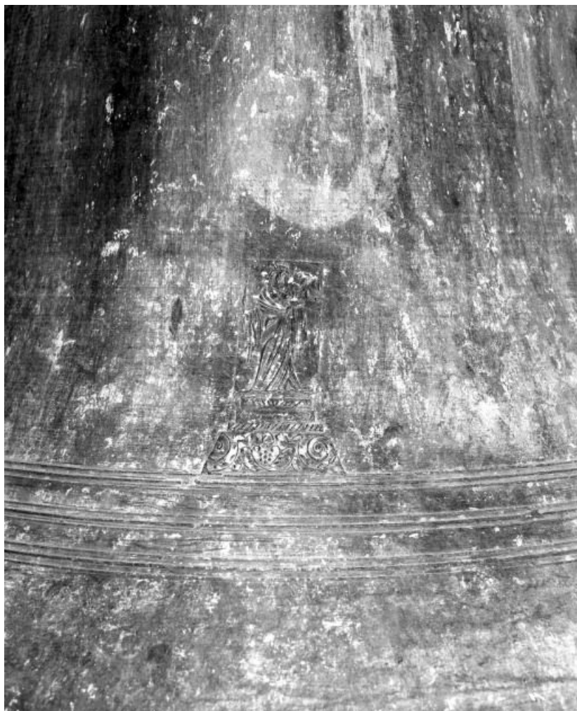
Détail : Vierge à l'Enfant.