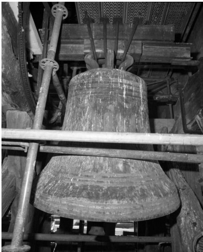
Vue pendant les travaux du clocher.