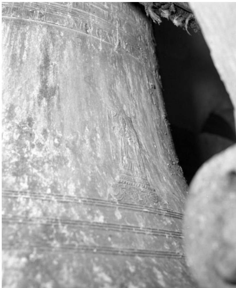
Détail : saint évêque.