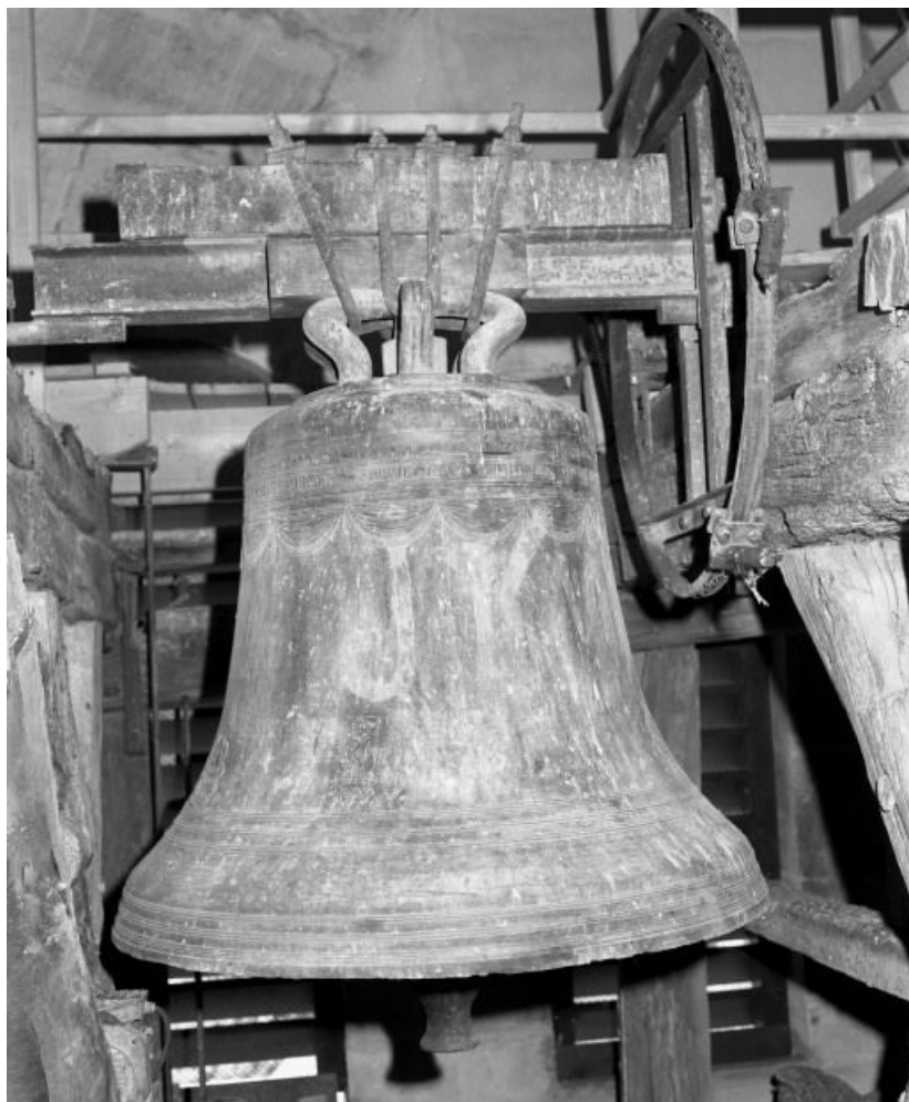
Vue d'ensemble, face postérieure.