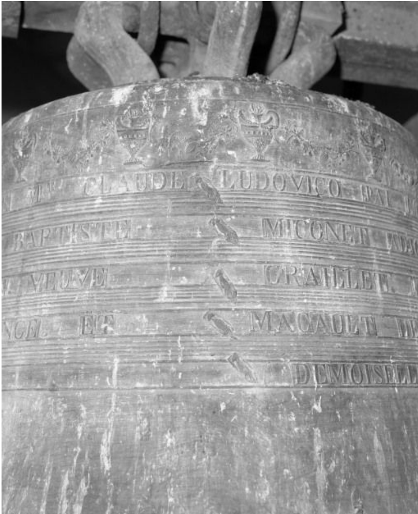
Détail : vase supérieur.