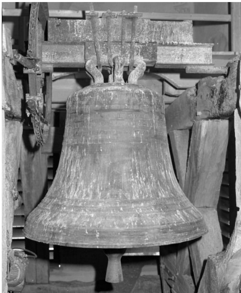
Vue d'ensemble face postérieure.