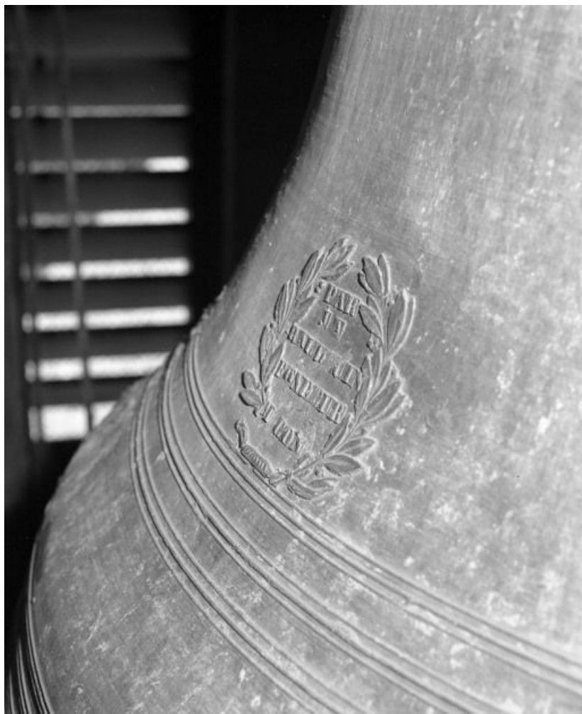
Détail : cachet du fondeur.