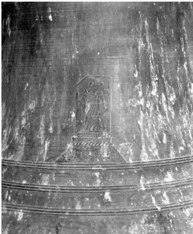
Détail : Vierge à l'Enfant.