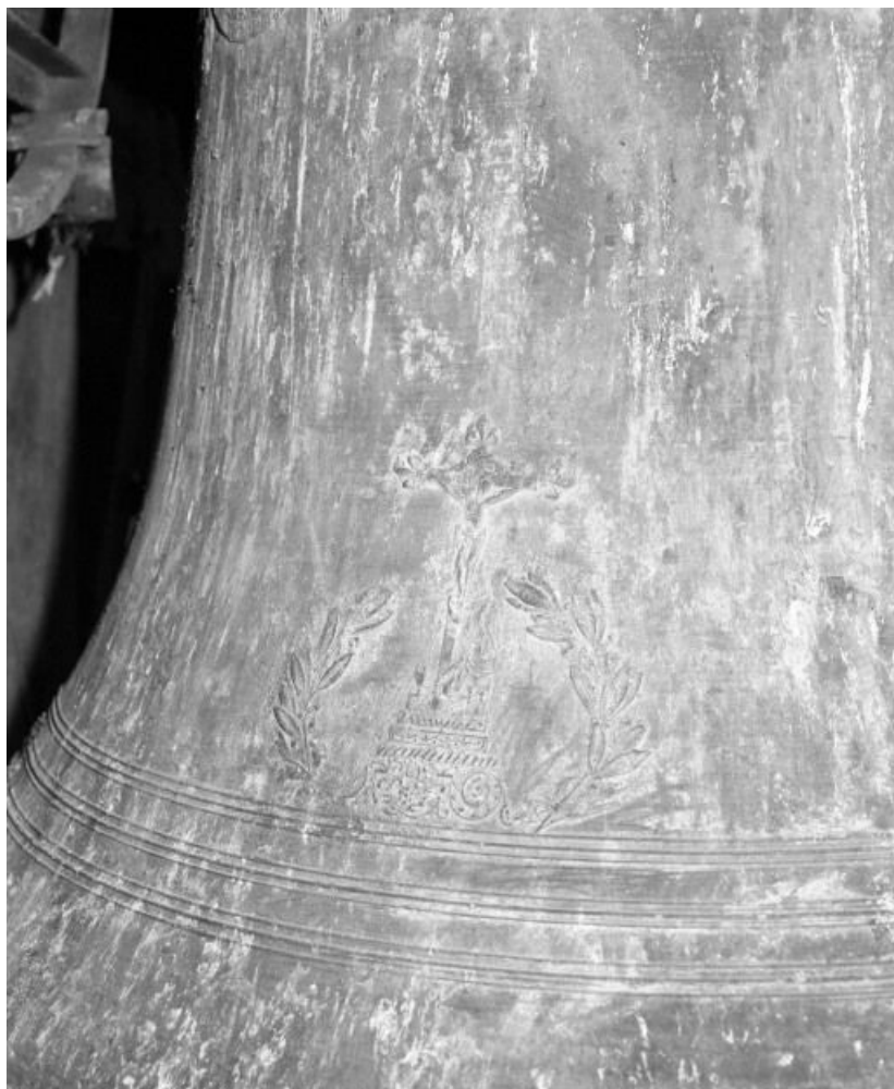
Détail : Christ en croix.