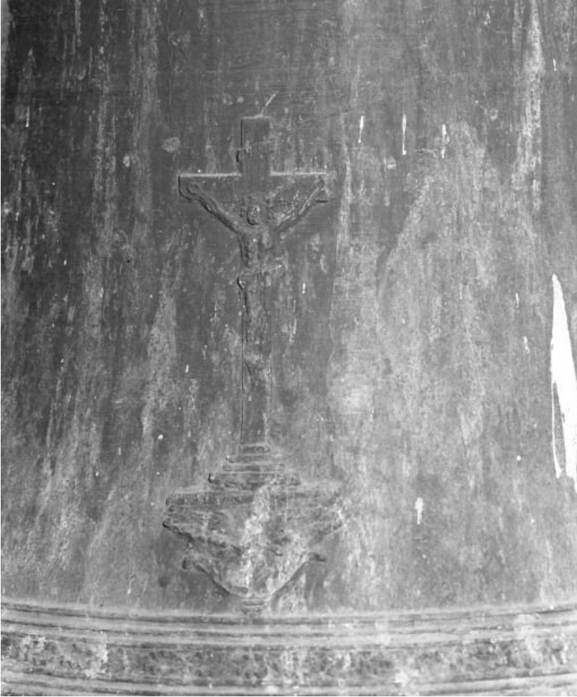
Détail : Christ en croix.