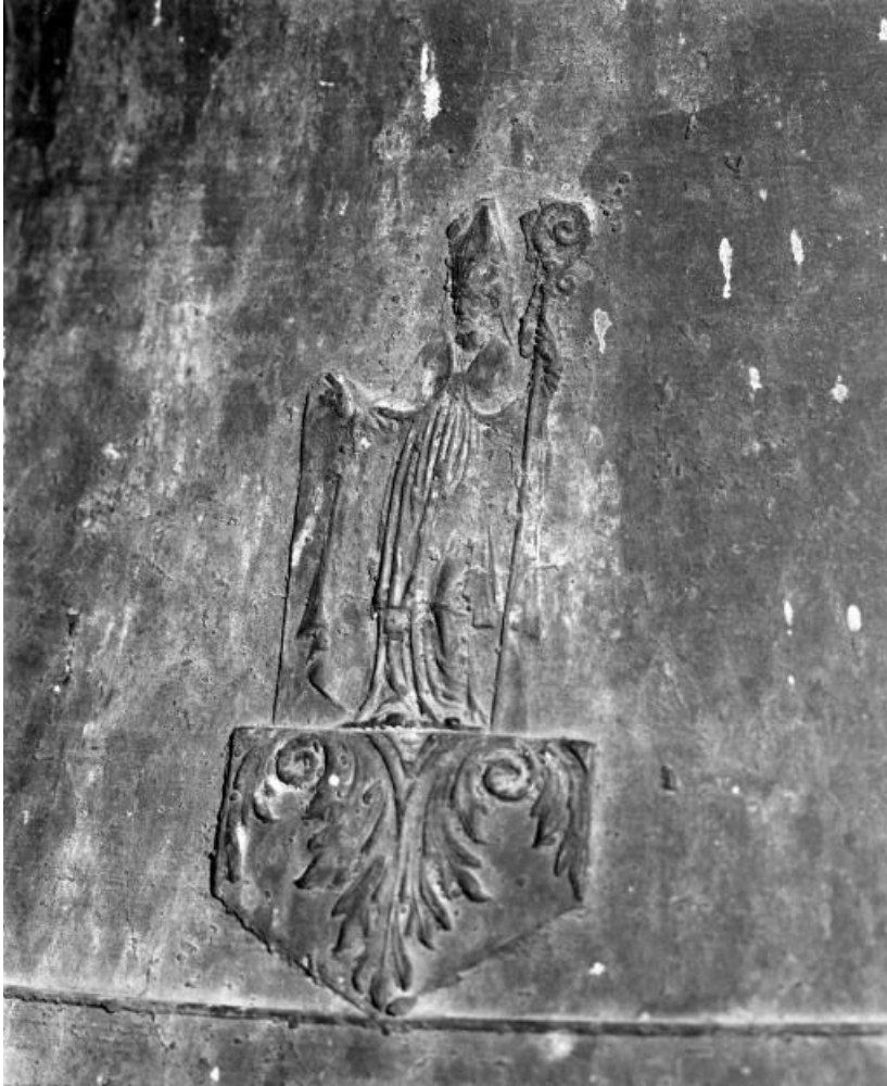
Détail : saint évêque.