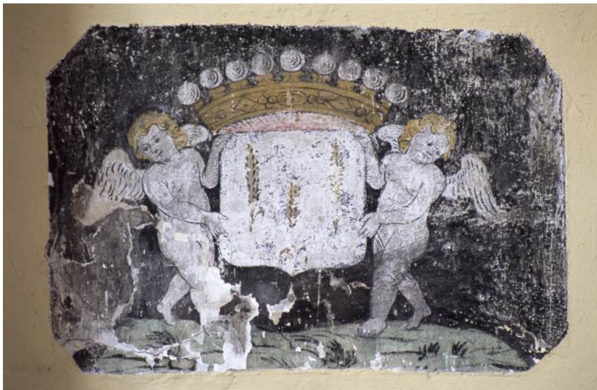
Litre funéraire aux armes de la famille Espiard.