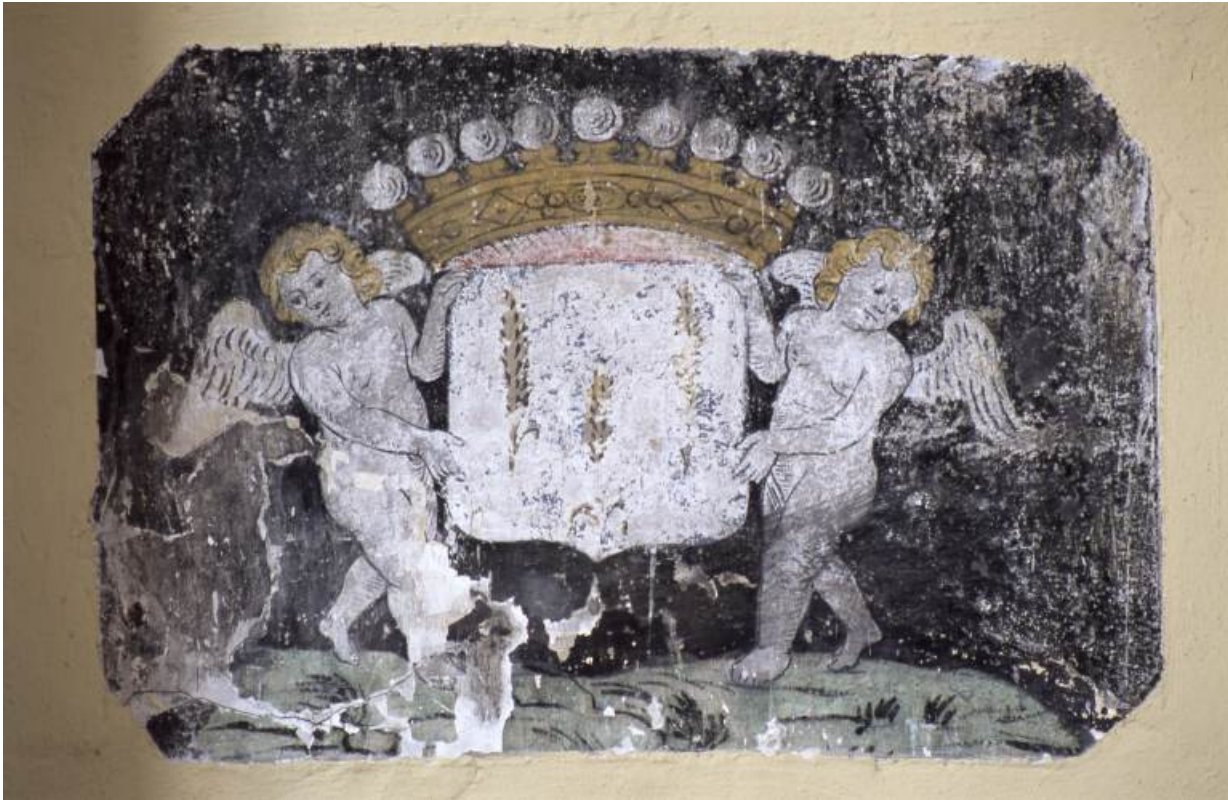
Litre funéraire aux armes de la famille Espiard.