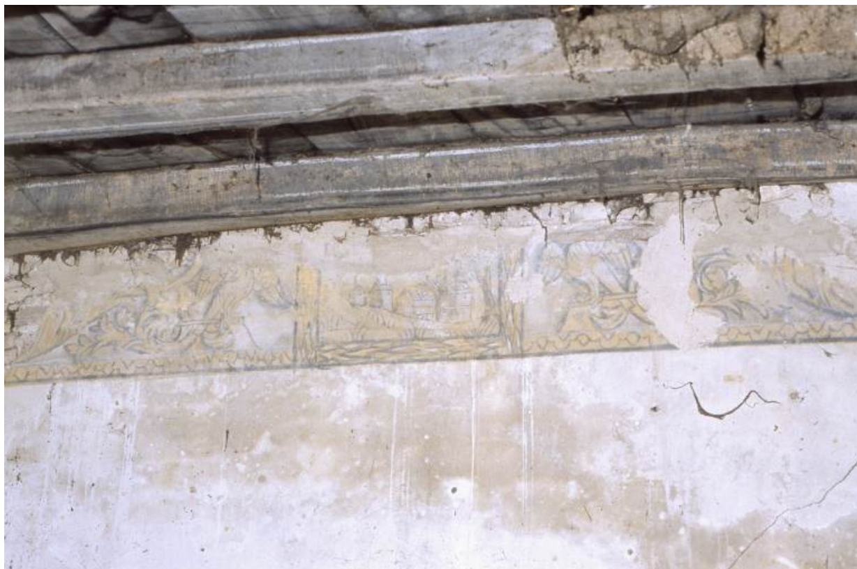
Vue de détail