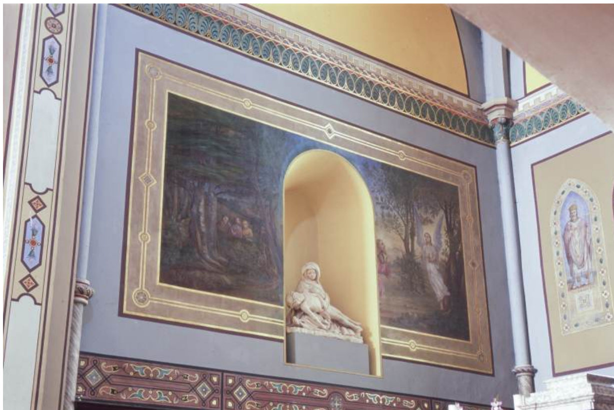
Agonie du Christ au jardin des Oliviers 71, Gergy église paroissiale Saint-Germain