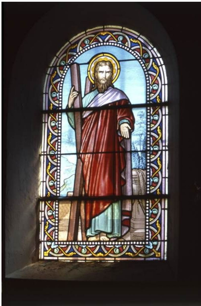
Vitrail droit du chœur : saint André.