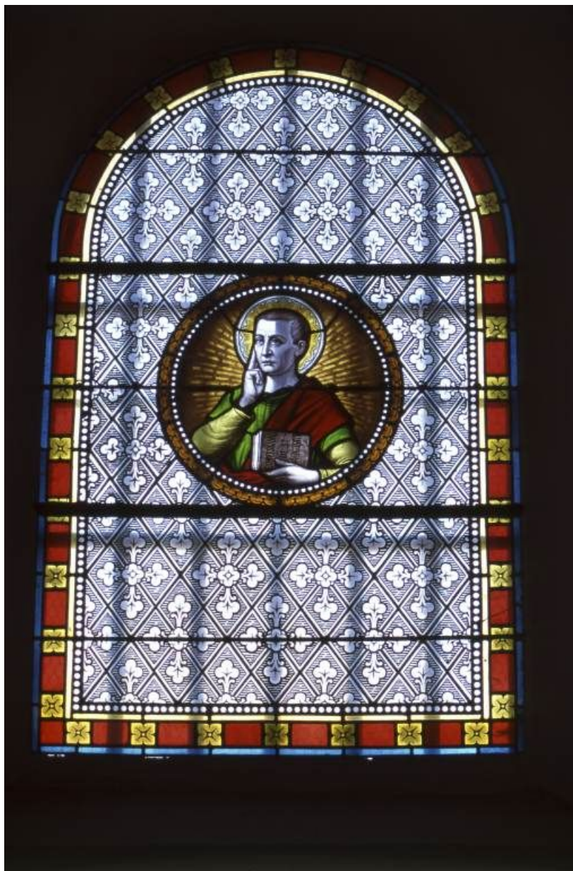
Vitrail de la nef : saint Augustin.