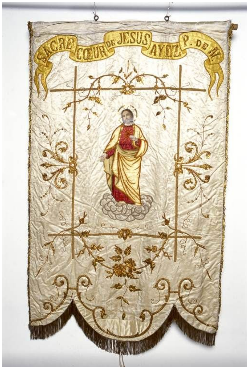
Bannière de procession : Sacré-Coeur.