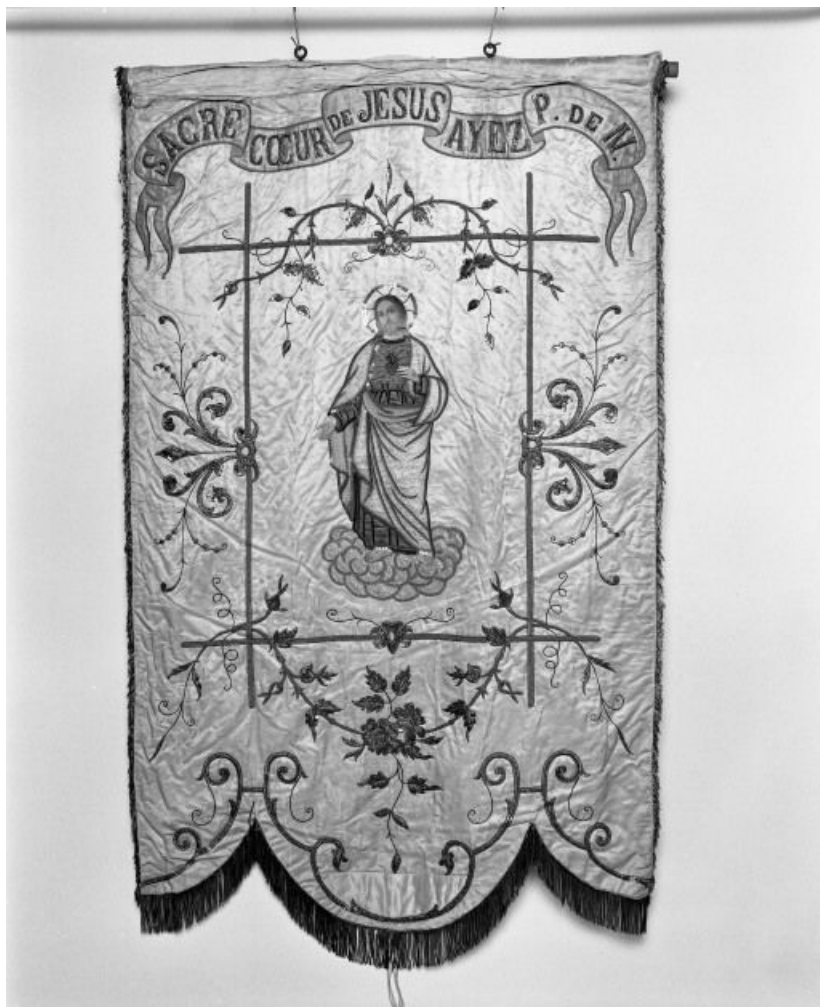
Bannière de procession : côté Sacré-cœur.