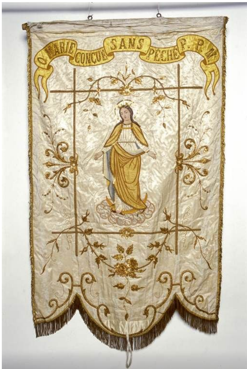
Bannière de procession : côté Immaculée Conception.