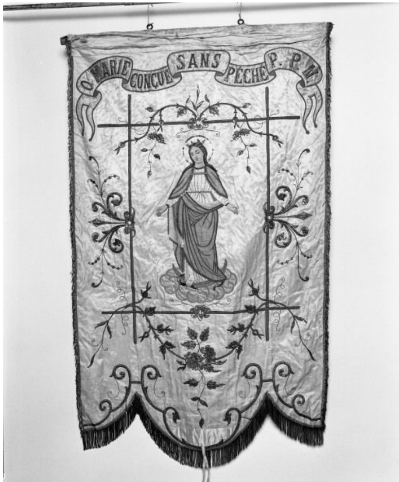
Bannière de procession : côté Immaculée Conception.