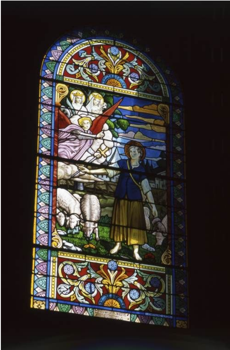
1ère fenêtre droite de la nef (baie 8) : Saint Michel, sainte Catherine et sainte Marguerite apparaissant à sainte Jeanne d'arc. 71, Allerey-sur-Saône R.D. 970