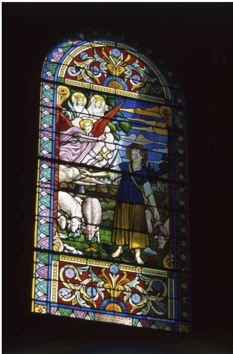
1ère fenêtre droite de la nef (baie 8) : Saint Michel, sainte Catherine et sainte Marguerite apparaissant à sainte Jeanne d'arc. 71, Allerey-sur-Saône R.D. 970