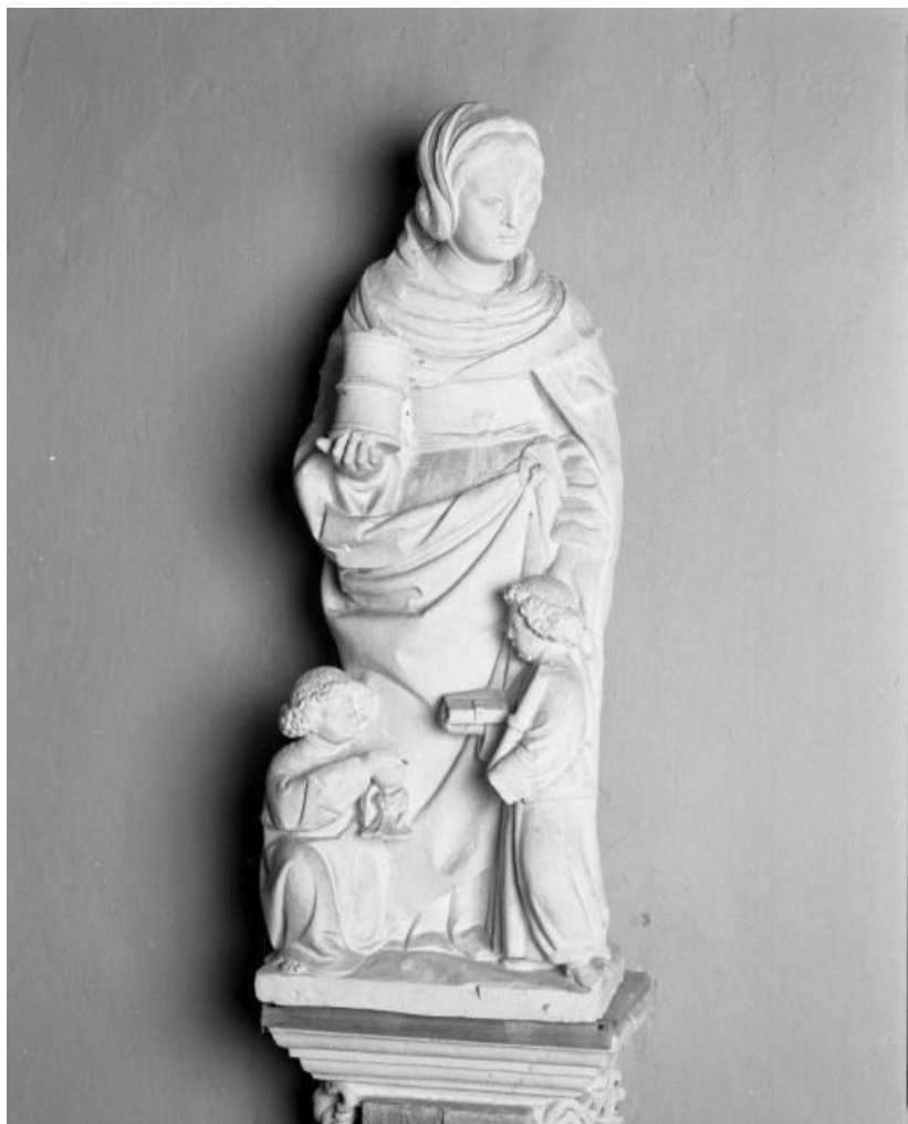
Groupe sculpté : Marie Salomé, de face.