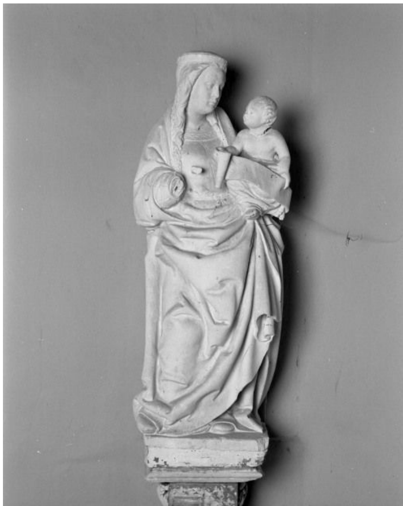
Statue : Vierge à l'Enfant.