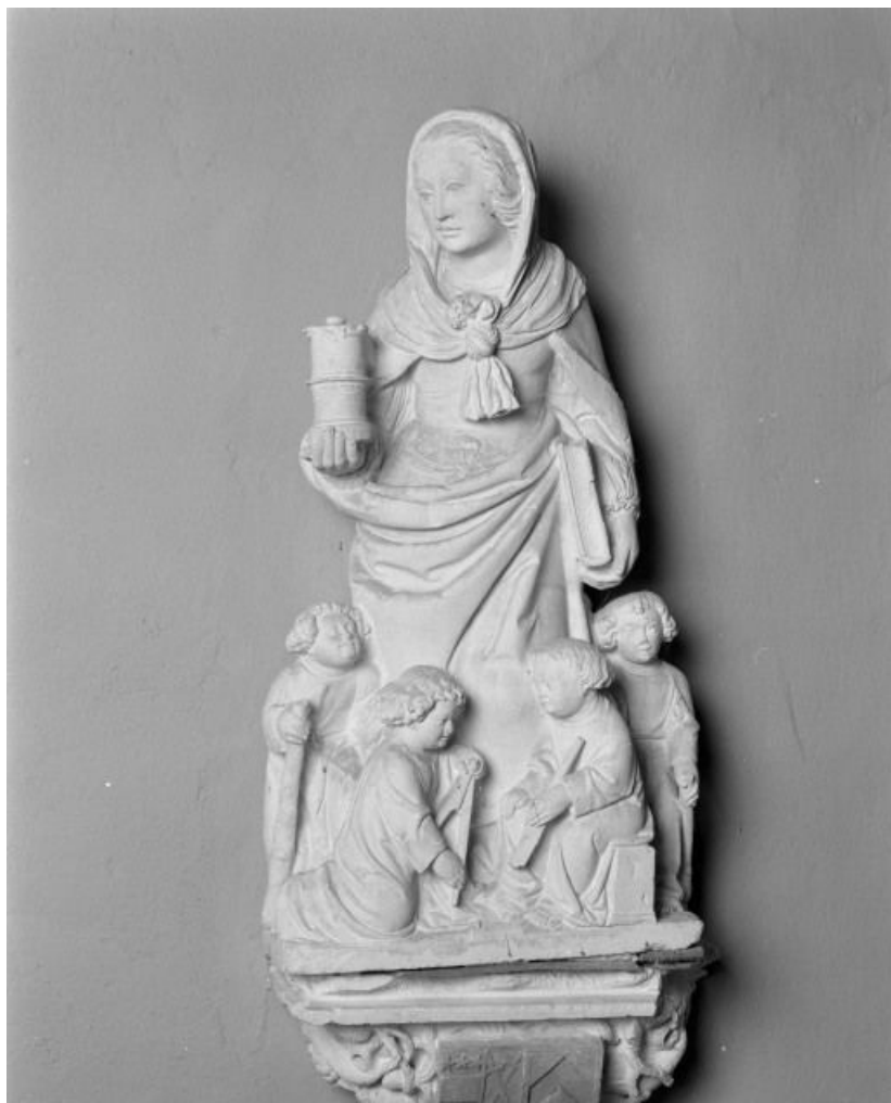
Groupe sculpté : Marie Cléophas, de face.