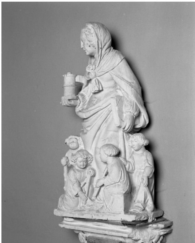
Groupe sculpté : Marie Cléophas, de trois-quarts.