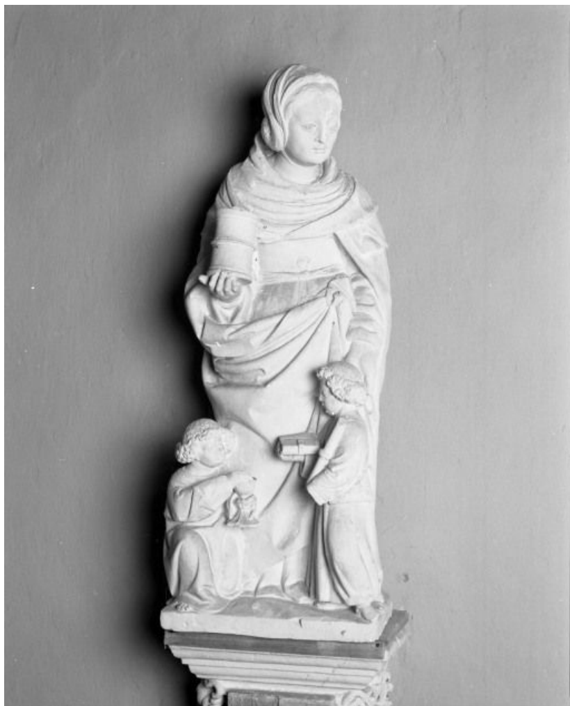
Groupe sculpté : Marie Salomé, de face.