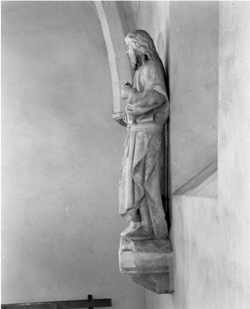
Vue de profil.