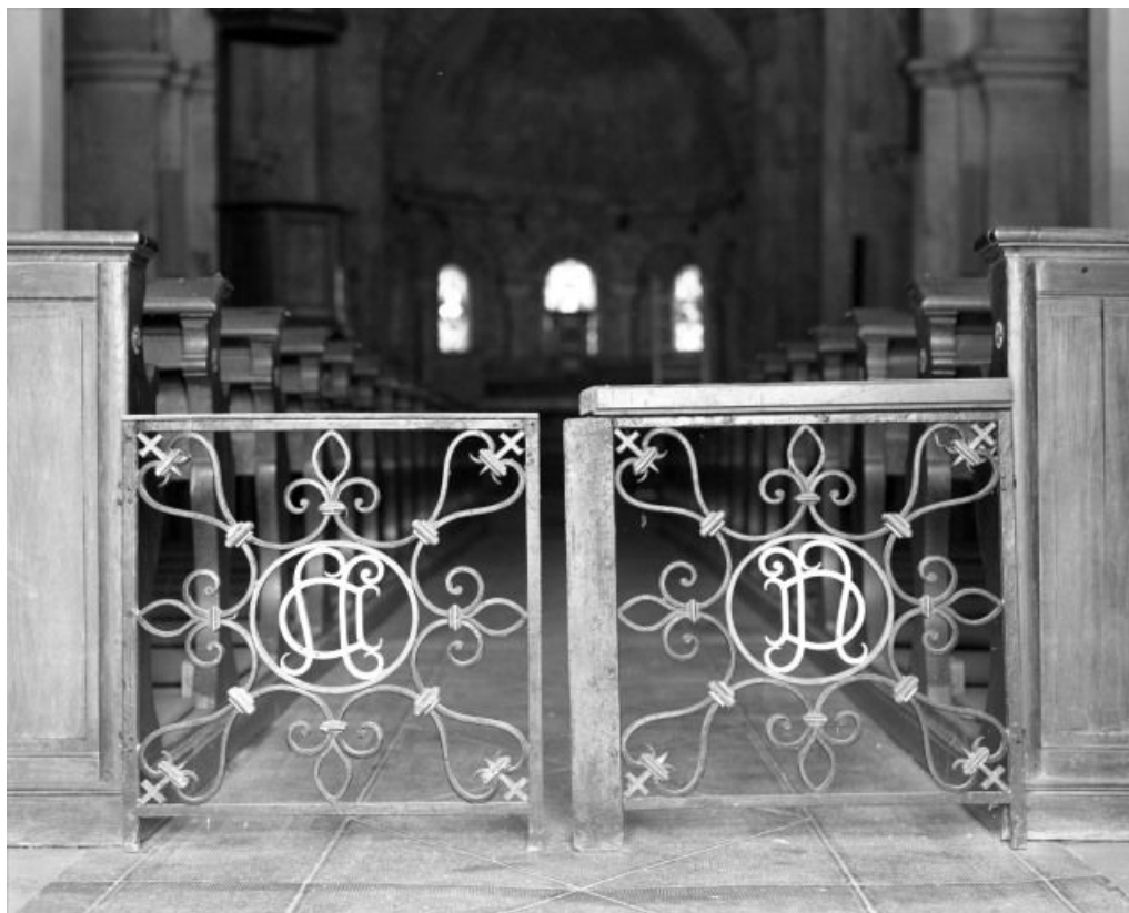
Portillon à 2 battants d'une clôture de choeur ou de chapelle. 71, Ciel CD 72