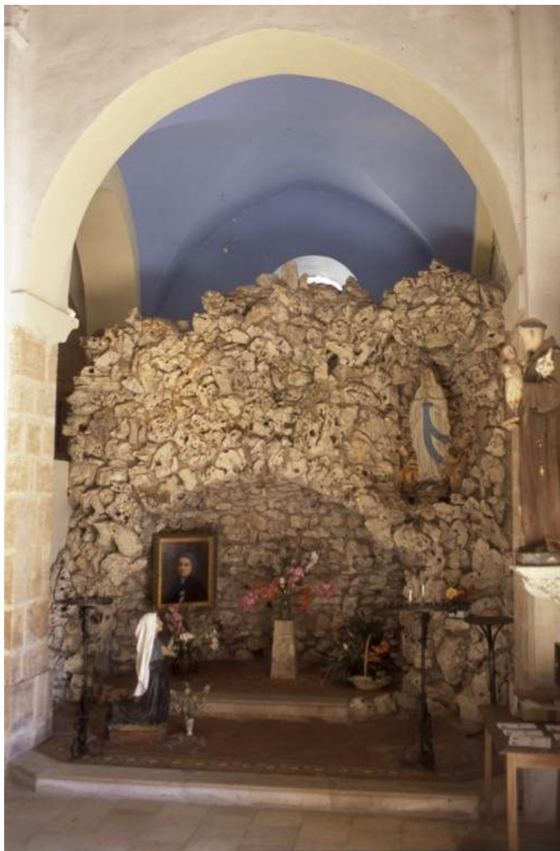
Groupe sculpté : reproduction de la grotte de Lourdes, 1892.