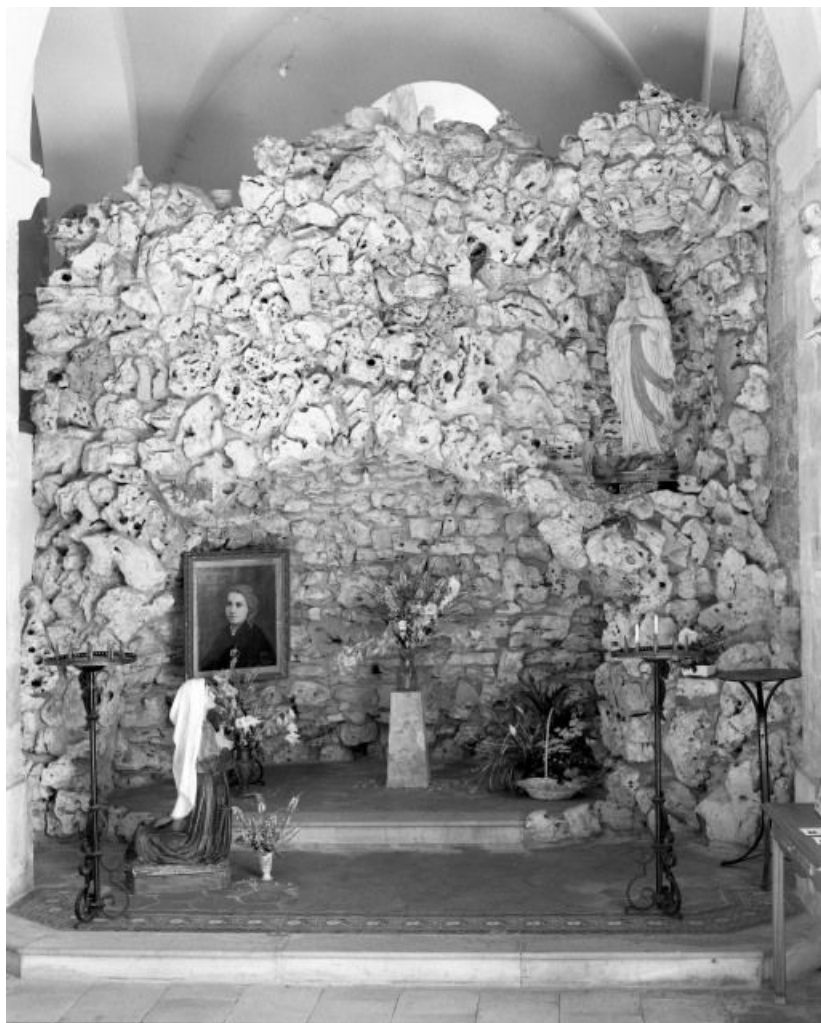
Groupe sculpté : reproduction de la grotte de Lourdes, 1892.