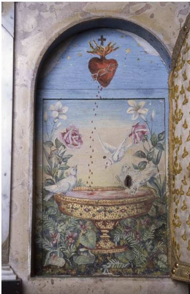
Intérieur du tabernacle du maître-autel.