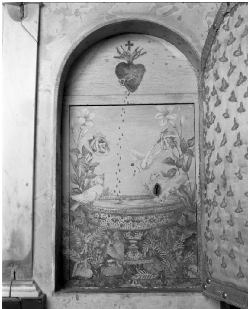
Intérieur du tabernacle du maître-autel.