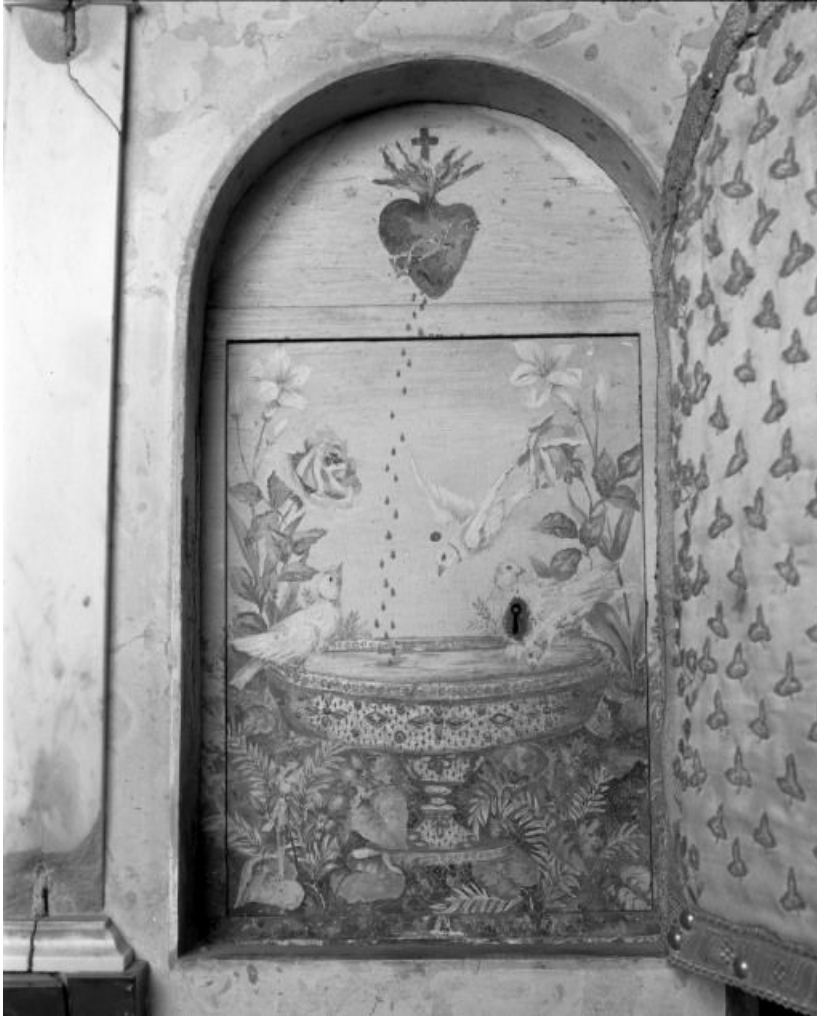
Intérieur du tabernacle du maître-autel.