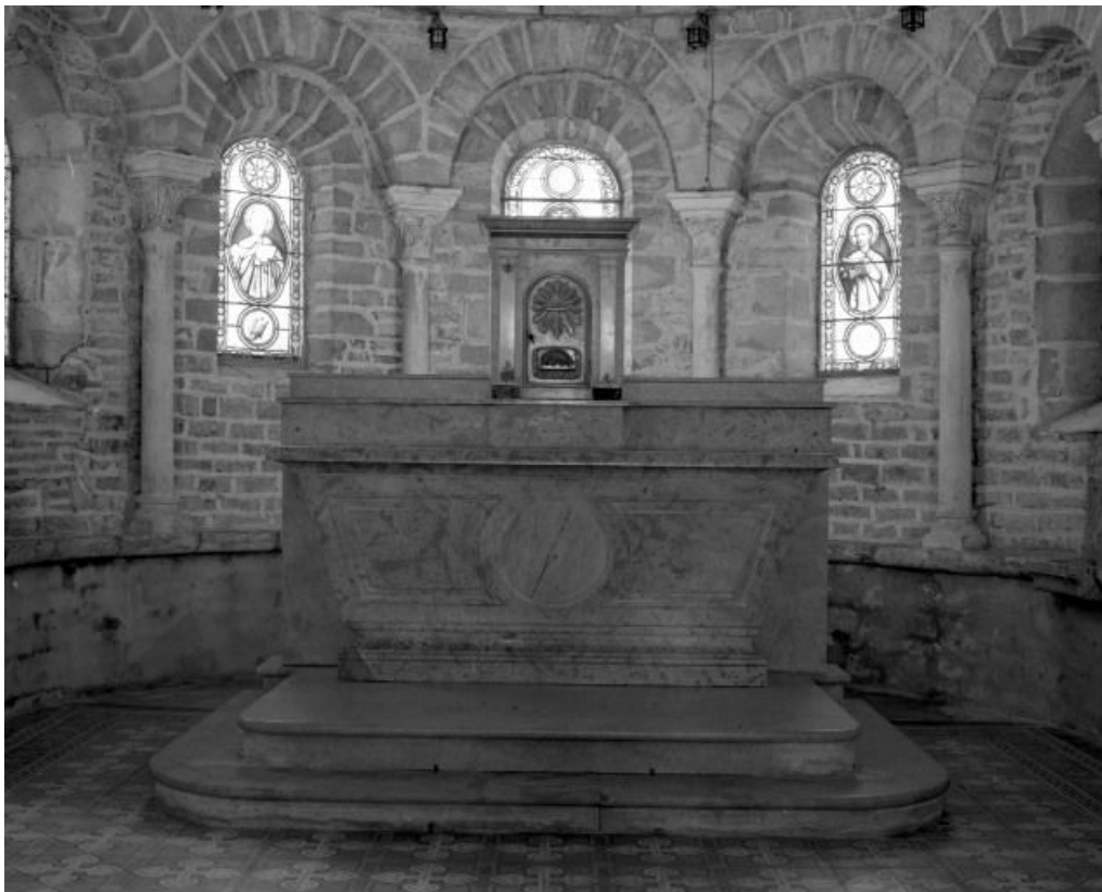
Vue d'ensemble du maître-autel et de son tabernacle.