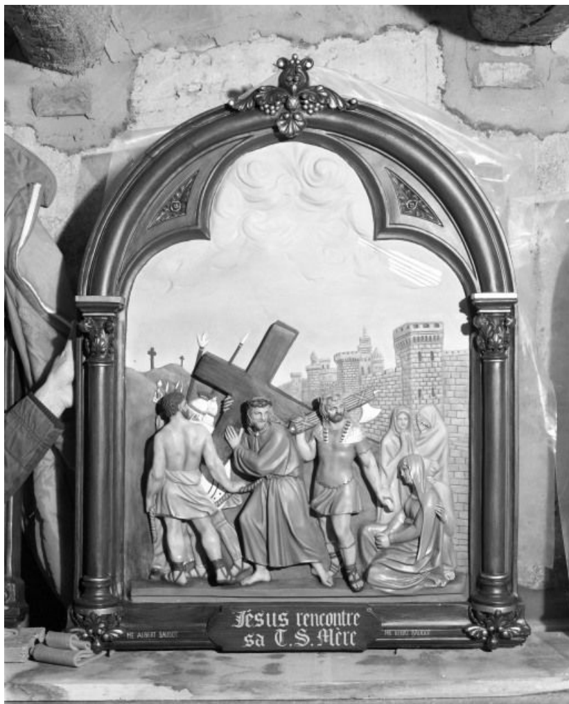
Chemin de croix : Jésus rencontre sa mère.