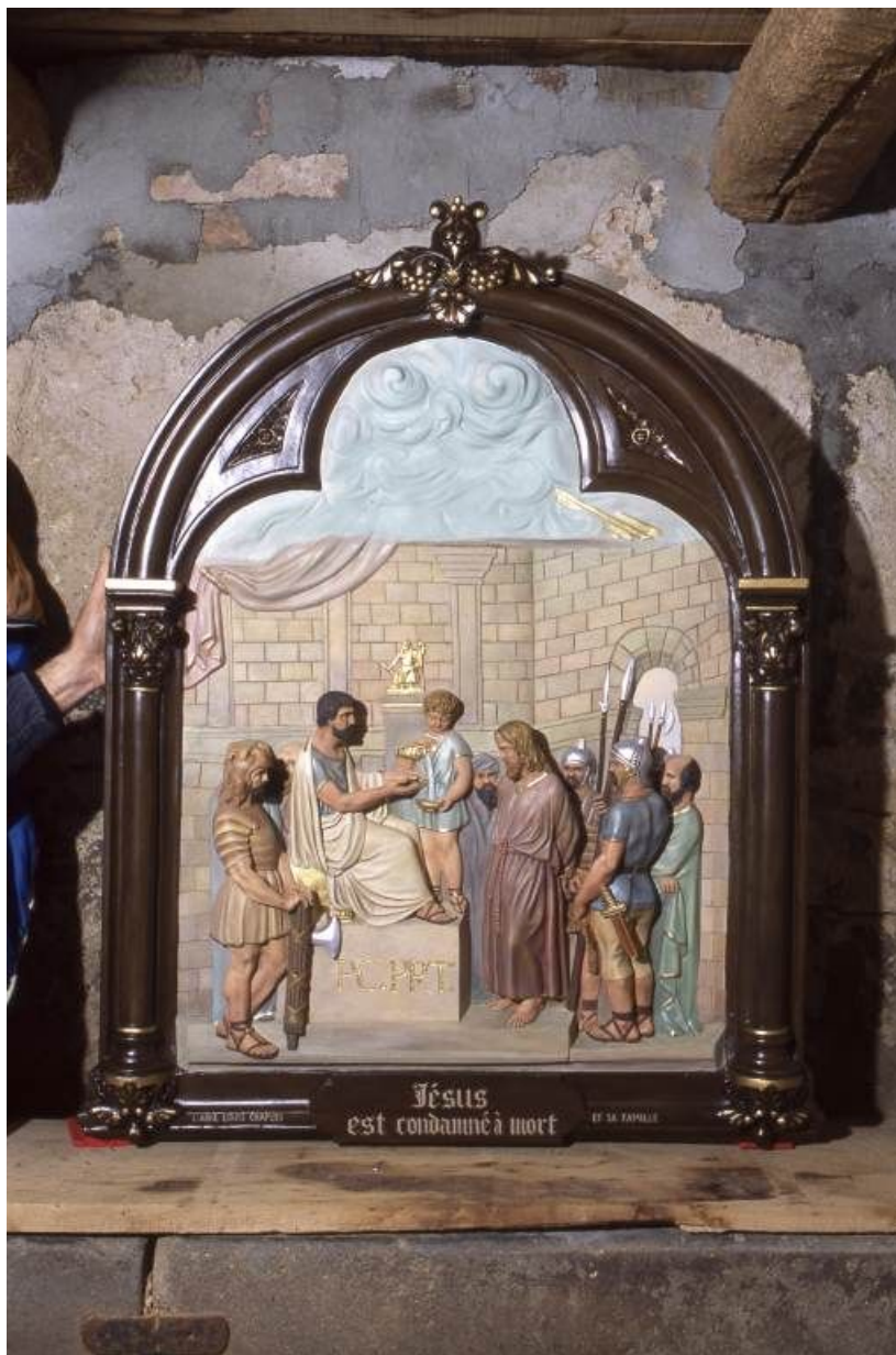
Chemin de croix : Jésus est condamné à mort.