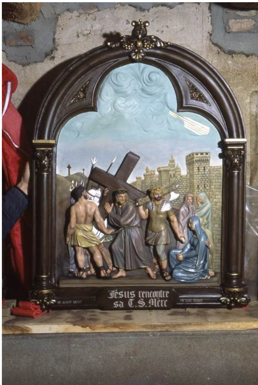
Chemin de croix : Jésus rencontre sa mère.