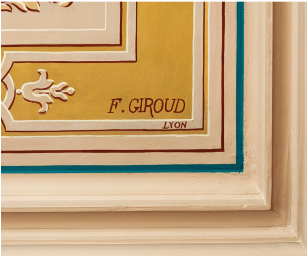
Grand foyer du public (salon d'honneur) : nom du peintre Giroud sur le plafond. 71, Autun place du Champ-de-Mars