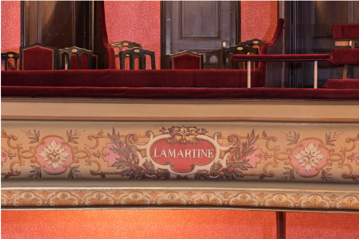
Garde-corps du 1er balcon (Lamartine).