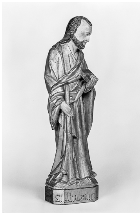
Vue de trois quarts droit.