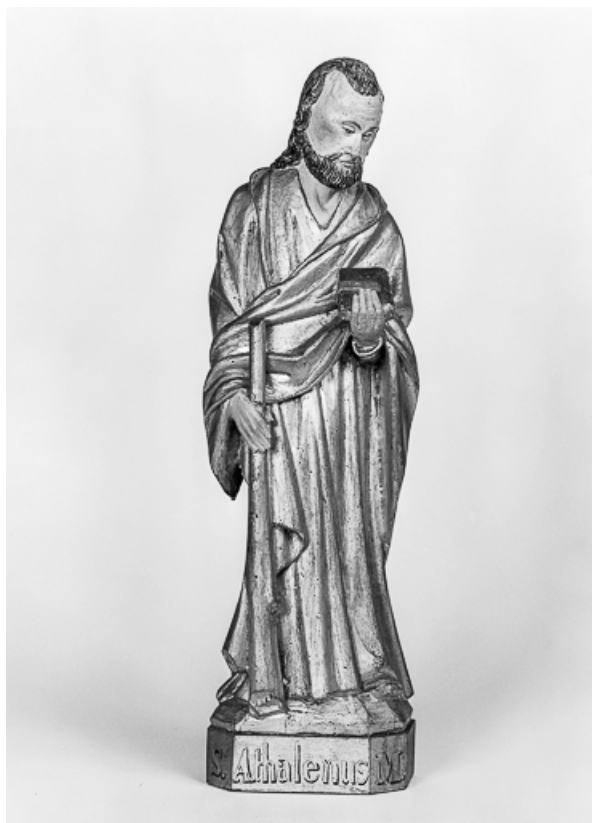
Vue de face.