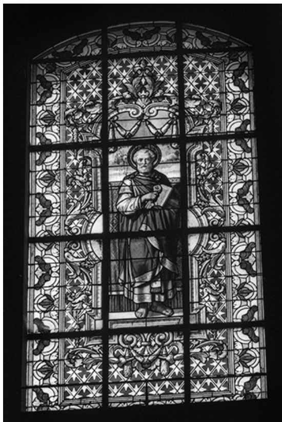
Baie 102 : vue d'ensemble.