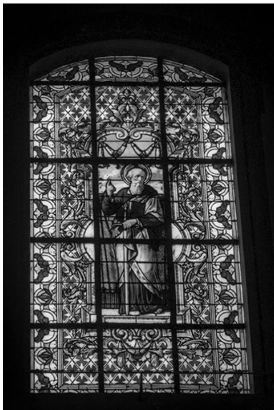
Baie 101 : vue d'ensemble.