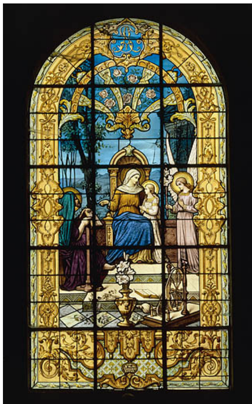
Baie 3 : vue d'ensemble.