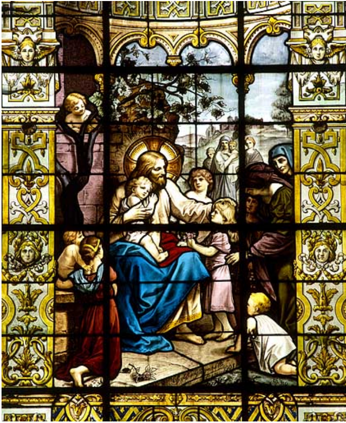
Baie 5 : partie centrale.