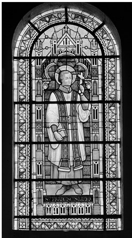
Baie 1 : vue d'ensemble.