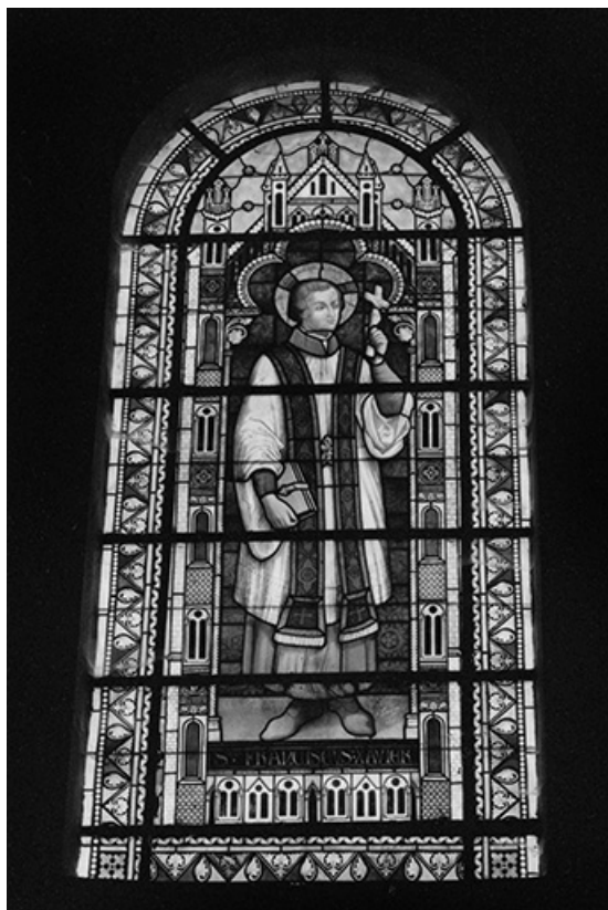
Baie 1 : vue d'ensemble.