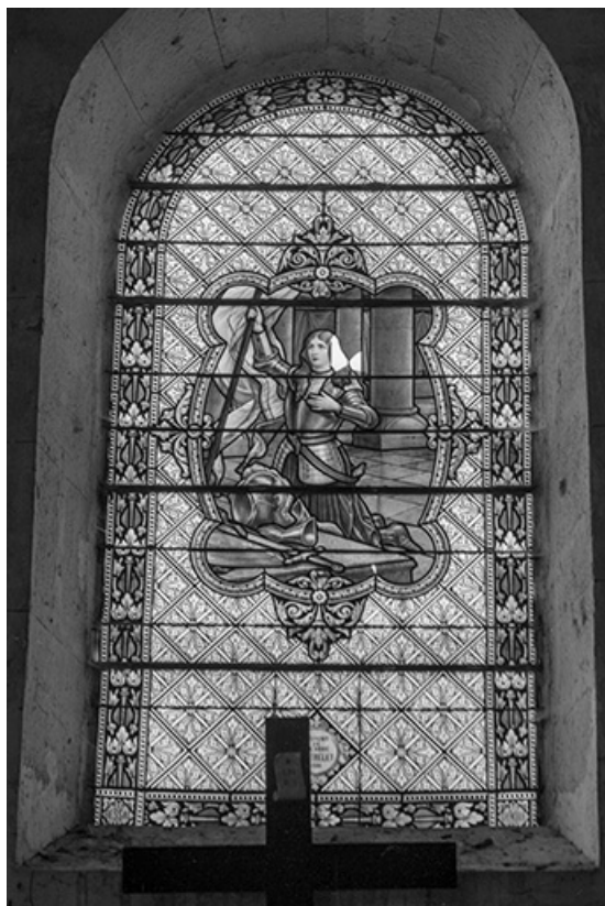
Baie 9 : vue d'ensemble.