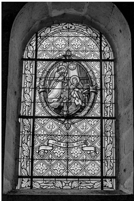
Baie 3 : vue d'ensemble.