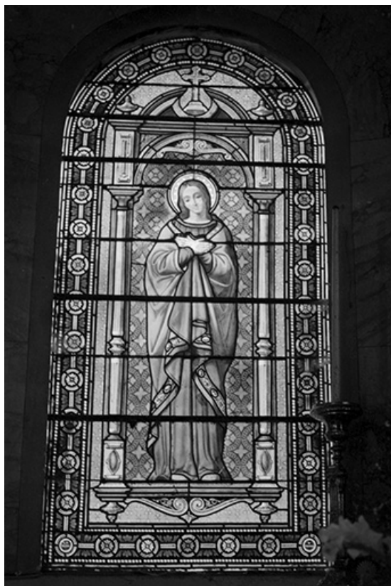
Baie 1 : vue d'ensemble.