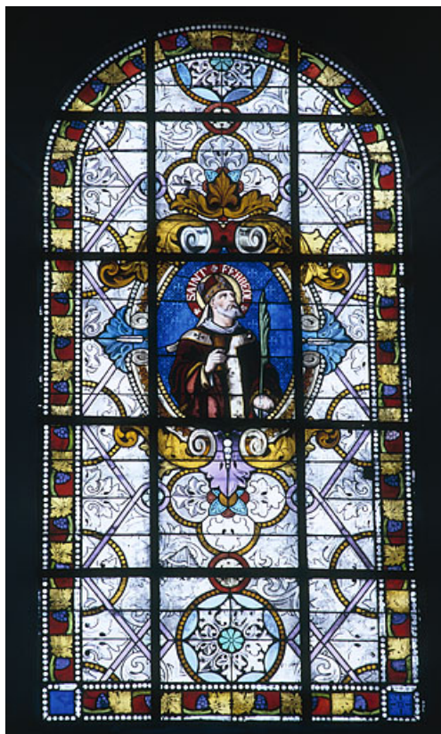
Baie 101 : saint Ferréol.

70, Scey-sur-Saône-et-Saint-Albin rue de l' Église