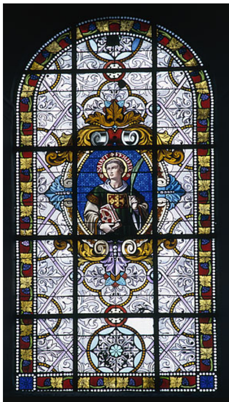
Baie 102 : saint Ferjeux.

70, Scey-sur-Saône-et-Saint-Albin rue de l' Église