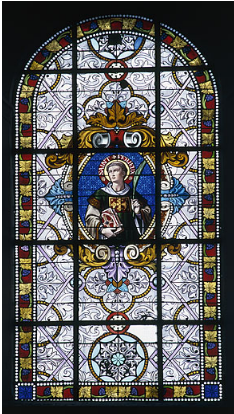
Baie 102 : saint Ferjeux.

70, Scey-sur-Saône-et-Saint-Albin rue de l' Église