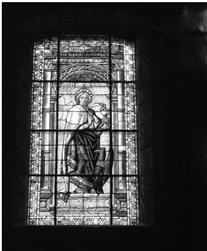
Baie 6 : vue d'ensemble.